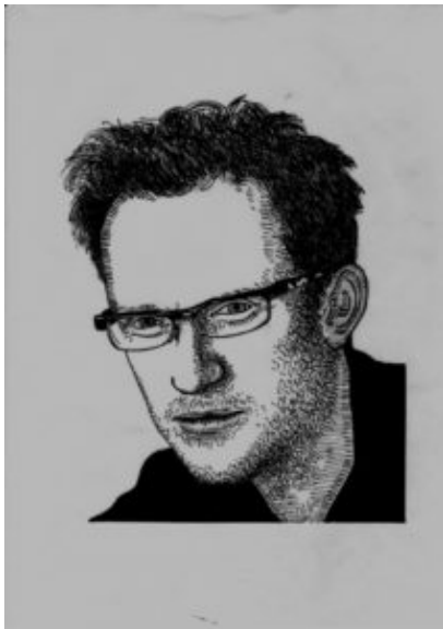
David van Reybrouck