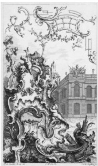
François Cuvilliés, Ornamentprent met rocailles, München, ca 1740.

[...] en in een hoekje van deze chaos, zullen ze een door angst verlamde cupido plaatsen, en erboven zetten ze een bloemslinger.