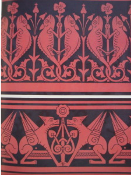
Christopher Dresser, Two grotesque dado-rails, uit Studies in Design , Londen 1874, Plate XIV.

Zijn diergrotesken zijn bovendien eenvoudig en hebben een regelmatig herhalend motief. Deze eenvoudige, eerste vorm van herhaling is niet expliciet genoemd in de voorbeelden die betrekking hadden op herhaling van oordelen over de vormgeving van decoratie en ornament. Het tweede deel van dit essay gaat over eenvoudige motieven.