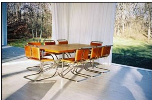
Mies van der Rohe, Farnsworth House, Plano, Illinois, 1945 en 1951

een plaats geven door hun waardering ervoor uit te spreken, zoals Victor Hugo en Charles Dickens. Met name Dickens wijst op de dwangmatigheid en dictatuur van voorschriften voor vormgeving, en ook voor het leven.