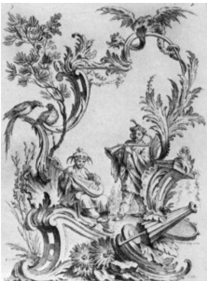
Nicolas Pineau, Ornamentprent met chinoiserie en grotesk, Parijs, 1727.

Slechte smaak woekert dus en moet daarom worden uitgeroeid. Le Blanc verbindt ook moeiteloos zijn eigen kritiek op ornament met de letterkunde: hij noemt Molière als goed voorbeeld van iemand die de grillen van zijn tijd in zijn toneelstukken eveneens aan de kaak stelde (207).