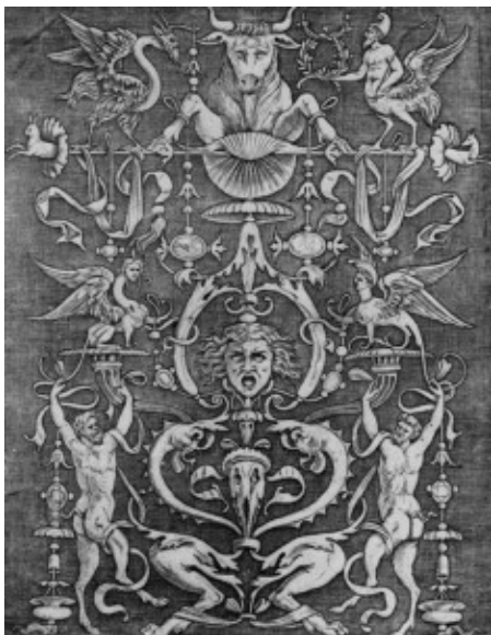
Agostino Musi (detto Veneziano), Prent met grotesk, 1530.

Socrates’ opvatting is rationalistisch en moraliserend, en in zijn kritiek lijken een goed ritme en goede harmonie het concept van herhaling als het ware te impliceren. Deze opvatting is in feite de dagelijkse praktijk bij de eerste vorm van herhalend ornament zoals van het behang: een zich regelmatig herhalend klein visueel motief als onopvallende decoratie. De opvatting heeft ook gevolgen voor een oordeel over ornament, de derde vorm van herhaling, want het belang dat Socrates hecht aan orde en harmonie werkt door in kritieken op een van de meest complexe ornamenten in de geschiedenis van vormgeving: de groteske.