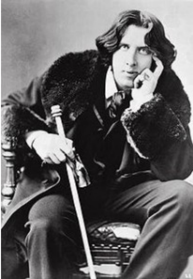
Oscar Wilde (1854-1900)