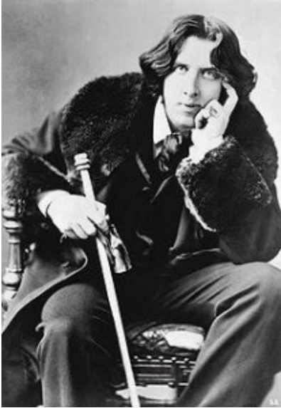
Oscar Wilde (1854-1900)