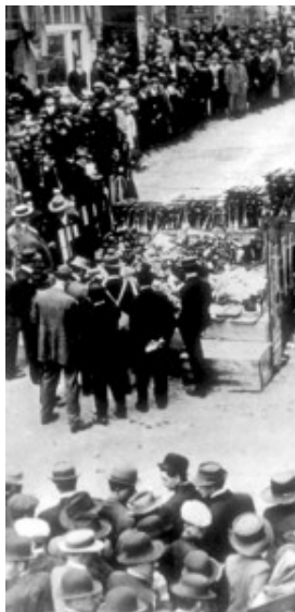
Verbranding opium en -pijpen San Francisco 1917

misdaad zou leiden. Hierbij hebben politici de neiging tot een sterke overdrijving van het probleem door het aantal gebruikers zwaar te overschatten.