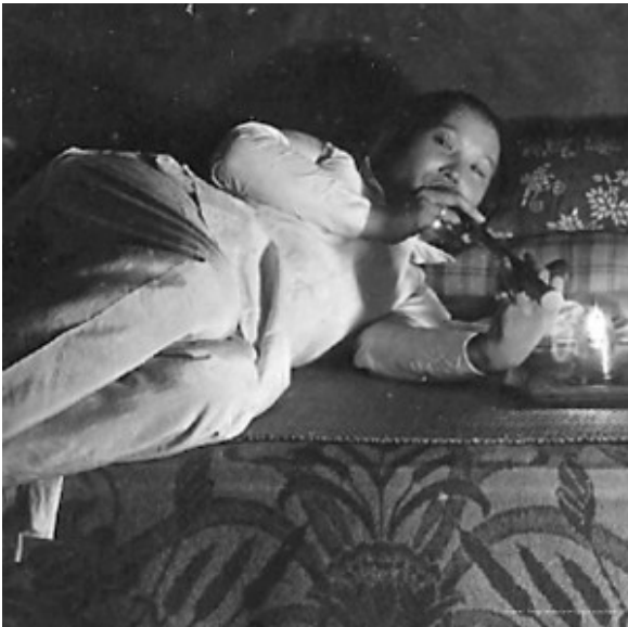
Opium schuiven

Tussen 1920 en 1960 kan er in Nederland grofweg een onderscheid worden gemaakt tussen recreatieve en gemedicaliseerde gebruikers, waarbij de laatste groep bestond uit morfinisten en cocaïnisten, niet zelden verslaafde artsen die hun middelen legaal kregen via apothekers.