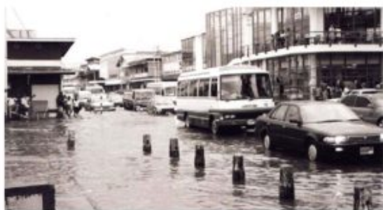
Afbeelding 1: Wateroverlast Paramaribo-Centrum (Yvon van der Pijl)

eveneens zorgen (slechte voedingstoestand, sociale dood). In het geval van bepaalde infectie-/virusziekten, zoals hiv/aids, lijkt er bovendien een correlatie te bestaan tussen etniciteit en klasse, hoewel we hier bijzonder voorzichtig mee moeten zijn (zie e.g. Eriksen 2002: 8). Met name onder de lage-/onderklasse Creolen en Marrons is een relatief hoog percentage hiv/aids-geïnficeerden te zien. [xix]