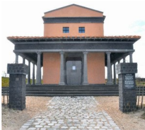
Afb. 6. Tempel Colijnsplaat (reconstructie)

“De richting waarop de heilige tempels van de onsterfelijke goden georiënteerd moeten staan zal men als volgt moeten vaststellen. Als er geen enkele belemmering is en men vrije keus heeft, moeten de tempel en het beeld dat in de cella staat opgesteld naar de avondlijke hemel kijken [...] Als de plaatselijke omstandigheden dit evenwel verhinderen, dan moet de bepaling van de richting in die zin worden gewijzigd, dat vanuit de tempels der goden een zo groot mogelijk deel van de stadsmuren zichtbaar is. Wanneer een tempel langs de rivier komt te staan [...] ligt het voor de hand dat hij over de oevers van de stroom uitziet.” [xiv]