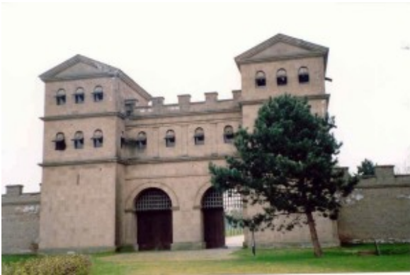
Afb. 10. Burginatumport Xanten