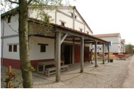
Afb. 11. Woonhuis met vakwerk Voorburg

Een tweede reden kan worden gezocht in het brandgevaar. Veel huizen waren van hout of vakwerk (afb.11) en gecombineerd met het feit dat men vuur gebruikte voor het koken en de verlichting moet brand geen denkbeeldige factor zijn geweest. Vitruvius is uiterst negatief over het brandbare vakwerk: