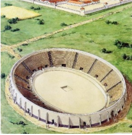
Afb. 9. Amfitheater Nijmegen