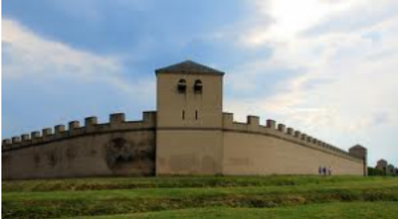
Afb.1. Stadsmuur Xanten