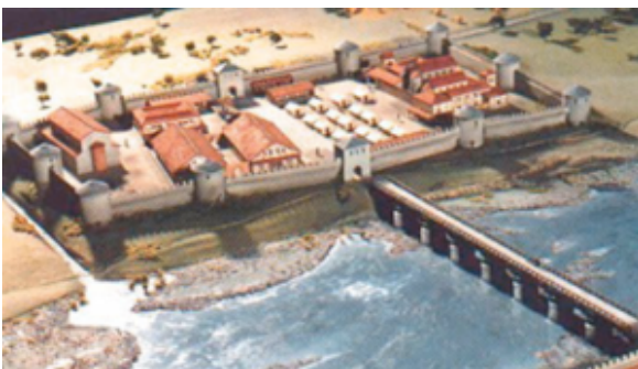
Afb. 2. Maastricht

In Xanten vertonen de wegen geen van alle een duidelijke knik naar links van de stad uit gezien, maar ze lopen er lijnrecht naar toe, zij het dat de noordwestelijke uitvalsweg een flauwe afwijking heeft, die echter nauwelijks de extra bescherming biedt die Vitruvius aangeeft. De weg moest hier naar links afbuigen om aan te sluiten op de limesweg. In Voorburg vertoont in ieder geval de weg vlak voor de Heliniumpoort echter wel een duidelijke knik, hetgeen erop zou kunnen wijzen dat hier het advies van Vitruvius, of van een andere stadsplanner, wel is opgevolgd. Later in de oudheid, wanneer steden het karakter van vestingen krijgen, zien wij steden die veel meer de adviezen van Vitruvius benaderen: ronde torens op steile hellingen, zoals bij voorbeeld Maastricht ( afb.2a ). In Keulen is er nog een te zien ( afb.3a ).