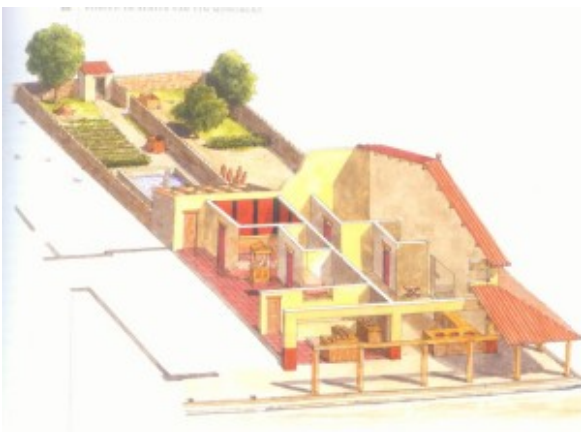
Afb. 4. Huis Voorburg

“In het noorden lijkt het vereist huizen gewelfd te maken, niet open maar zoveel mogelijk gesloten en gericht naar de warme kant.” [vi]