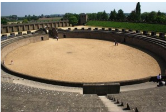
Afb. 8. Amfitheater Xanten

tempelpaar in Nijmegen. Binnen steden moesten de tempels passen in het stratenplan. Ook hier kunnen we niet zeggen dat ze naar één kant zijn gericht. In Nijmegen lag de ingang van de tempels op het noordwesten; de Haventempel van Xanten ( afb.7 ) had de ingang op het zuidoosten. De Matronentempel, ook in Xanten, heeft de ingang aan de noordoostkant. Tempel 1 van Elst, buiten de stad, had de ingang op het zuiden. Mogelijk werd dit gedaan als oriëntering naar de Waal, maar de tempel lag niet pal aan de Waal. De meeste van deze genoemde tempels zijn van het Gallo-Romeinse type: een hoog middengedeelte met rondom een enkele zuilengalerij. Vitruvius spreekt hier niet over.