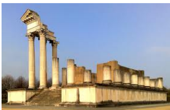
Afb. 7. Hafentempel Xanten

Tempels kwamen in onze streken zowel op het platteland als in de steden voor. Buiten de steden kwamen zeer grote tempels voor, zoals bij voorbeeld in Kessel aan de Waal, bij Elst (Gld.) en Colijnsplaat (afb.6). Binnen de steden kwamen grotere en kleinere tempels voor, soms ook in paren. Een voorbeeld is het