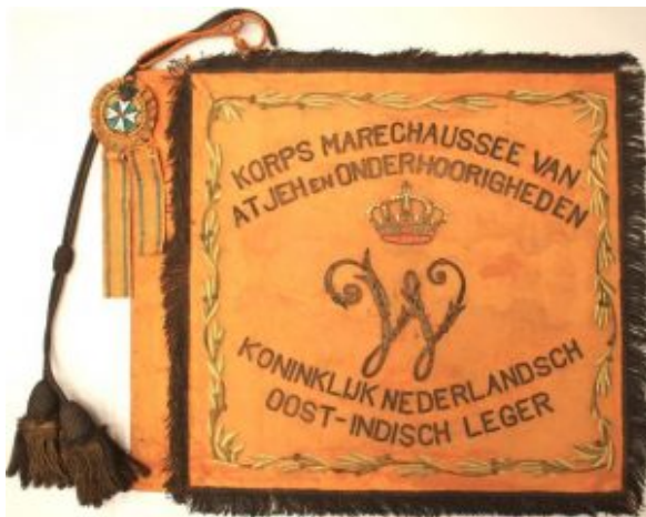
Vaandel van het Korps Marechaussee te voet van Atjeh en Onderhorigheden, voorzien van de Militaire Willems-Orde. Collectie Museum Bronbeek

Het betreffen 19 officieren, 2 adelborsten en de overige zijn onderofficier, 13 van deze benoemingen behoren tot het onderdeel marine.