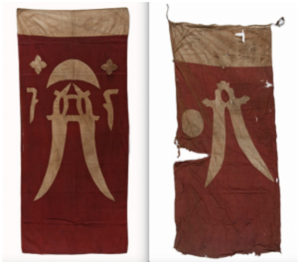
Voorbeelden rijksvlag, collectie Nationaal Museum van Wereldculturen