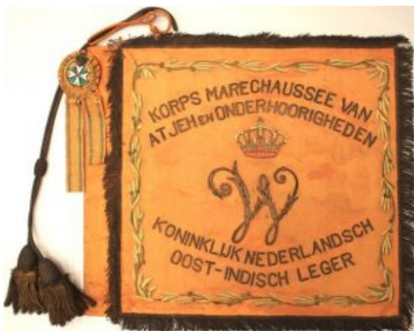
Vaandel van het Korps Marechaussee te voet van Atjeh en Onderhorigheden, voorzien van de Militaire Willems-Orde.

Het betreffen 19 officieren, 2 adelborsten en de overige zijn onderofficier, 13 van deze benoemingen behoren tot het onderdeel marine.