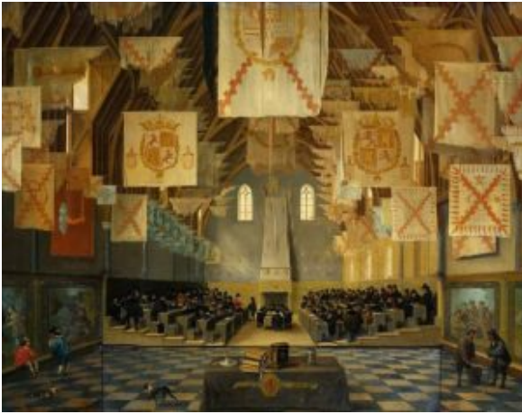
De Ridderzaal, 1651.

Het veroveren van een vlag, vaandel of standaard op de vijand is al een eeuwenoude oorlogshandeling. Zo hadden de Romeinen hun legioenstandaarden met in top de aquila, de samoerai droegen de mon oftewel familiewapen op hun vlag en de VOC had het bekende monogram verwerkt in de witte baan van de Nederlandse vlag. In Europa, Midden-Oosten en Azië hadden vlaggen gelijkwaardige functies en gebruiken, zowel in vestingen, als op schepen en slagvelden. Vaak waren ze voorzien van een wapen of symbool in felle kleuren. Eigenlijk was het niets anders dan een simpel communicatiemiddel waarmee men op afstand kon aangeven wie men was en wat men wilde. Vlaggen konden daarbij ook een grote symbolische waarde krijgen. Bijvoorbeeld als zij een wapen van een heerser mochten voeren of een symbool van een speciale eenheid. Vlaggen met een rijke historie werden gekoesterd en met groot respect behandeld. Deze werden doorgaans dan ook verdedigd tot de dood erop volgde. Het neerhalen van een vlag door de vijand betekende dat zij waren doorgedrongen tot in het hart van de verdediging en dat de strijd grotendeels gestreden was. Het buitmaken van een vlag op de vijand werd gezien als een daad van moed. Vele vlaggen werden na hun verovering vaak opgehangen als trofee. Zo hing de ridderzaal in het Binnenhof vol met veroverde vlaggen en vaandels.