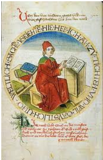
Heinrich der Teichner Ills.: de.wikipedia.org