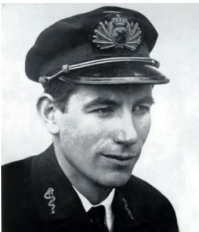
J. Slauerhoff (1898-1936)