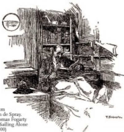
Kapitein Joshua Slocum lezend in de kajuit van de Spray. Pentekening door Thomas Hoar in de eerste druk van Sailing Alone Around the World (1900)

'Dreaming oneself away to sea' - de Engelse uitdrukking laat zich niet gemakkelijk in het Nederlands vertalen, maar een rakere typering van de afwijking waarmee ik sinds mijn vroege jeugd behept ben weet ik niet te bedenken. De symptomen: een onblusbare belangstelling voor alles wat kan varen, van pieremachochels tot windjammers, een levenslange honger naar verhalen over