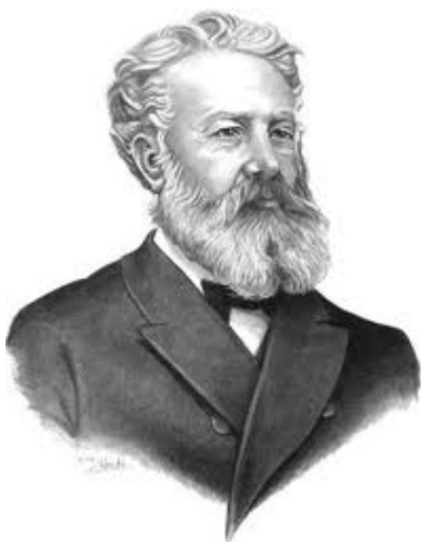
Jules Verne (1828-1905)