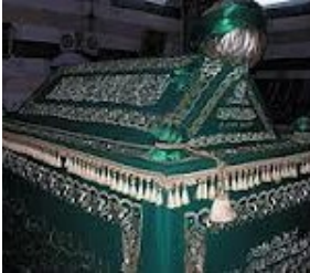
Graf van Saladin

staan twee sarcofagen broederlijk naast elkaar. In de witmarmeren doodskest liggen de resten van Saladin, in die van steen en donkerbruin houtsnijwerk ligt zijn particuliere secretaris. In 1898 schonk de Duitse keizer Wilhelm de Tweede tijdens zijn bezoek aan Damascus geld om de restauratie van het mausoleum mogelijk te maken.