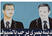
Bashar al Assad, President of Syria & father,