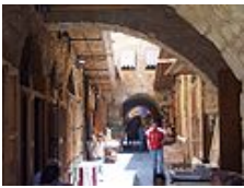
steegje saida oude stad

De kruisvaarders trokken in een rustig tempo langs de kust van Noord-Libanon in de richting van Beiroet, in die tijd een onopvallend vissersplaatsje dat zich later onder het bewind van de Europeanen meer en meer ontwikkelde tot een belangrijke havenplaats. Ze passeerden het oude Byblos en staken vervolgens de Hondsrivier over, die de grens vormde tussen het Seltsjoekse rijk en het Fatimidenkalifaat. De komst van de kruisridders veranderde niet zo veel aan de opstelling van de Fatimiden die al hun aandacht nodig hadden voor de versterking van Jeruzalem en niet bijster geïnteresseerd waren in de Libanese kustplaatsen waar de emirs weldra vrede sloten met de christelijke indringers. De laatste pleisterplaats was het vissersdorp Sur (Tyre) waar de kruisvaarders twee dagen bivakkeerden alvorens hun blik te richten op Palestina.