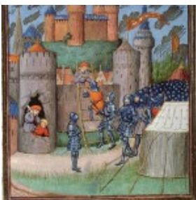
Belegering van Antiochië

Het moet stikdonker zijn geweest in de nacht van twee op drie juni 1098. 'Een opkomend onweer, ratelende donderslagen, gierende stormwinden en rondschietende kometen door een in gloed staande lucht gaven de bijgelovige kruisvaarders het teken dat de tijd van de verdelging der ongelovigen nabij was.' Al dit natuurgeweld verhinderde tevens dat de schildwachten het gerucht van de samenzweerders hoorden. Firoez had nog geprobeerd zijn broer, die een van de