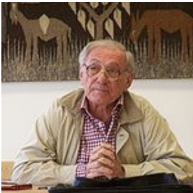
Sadiq Jalal Al-Azm