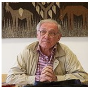
Sadiq Jalal Al-Azm