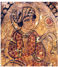
Al-Hakim bi- Amr Allah (996-1021)