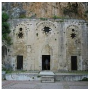
De kerk van de