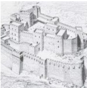
Krak des chevaliers (art)

'Damas, Damas,' schreeuwt een magere taxichauffeur de longen uit zijn tere lijf op het terrein van het drukke busstation aan de Bagdad Avenue in de kustplaats