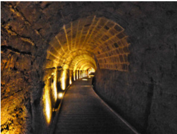
Kruisvaarders tunnel - verbinding tussen fort en haven

De kruisvaarders waren zeer verrukt over deze brief. Zij zagen hierin een teken dat God hen beschermde omdat Hij vogels stuurde die de geheimen van de ongelovigen verraadden. Eind mei kwamen de christenen in Caesarea aan. Zij verbleven hier vier volle dagen om op waardige wijze het pinksterfeest te vieren. Twee jaar later, in 1101, keerden ze nog eens terug, veroverden de stad en vermoordden alle bewoners die zich in paniek in de moskee hadden teruggetrokken. ‘De muren waren destijds dertig voet breed toen de kruisvaarders hier voor de poorten lagen, maar op zich vormde dat geen belemmering om de stad te overvallen en de zaak hier te plunderen,’ zegt de Amerikaanse archeoloog Kenneth G. Holum van de Universiteit van Maryland. Holum werkt sinds 1992 als teamleider van een groep archeologen die onafgebroken onderzoek doen naar de kruisvaarders geschiedenis in Caesarea. ‘Tijdens de plunderingen door de kruisvaarders werd volgens de kronieken de Heilige Graal, de Sacro Cantino, gevonden en dat is de heiligste relikwie die het christendom heeft nagelaten. Er lagen hier in die tijd veel Italiaanse schepen voor de kust, die voor de proviandering van de kruisvaarders zorgden. De kapitein van een Genuaans schip zou de Heilige Graal mee naar Europa hebben genomen.’