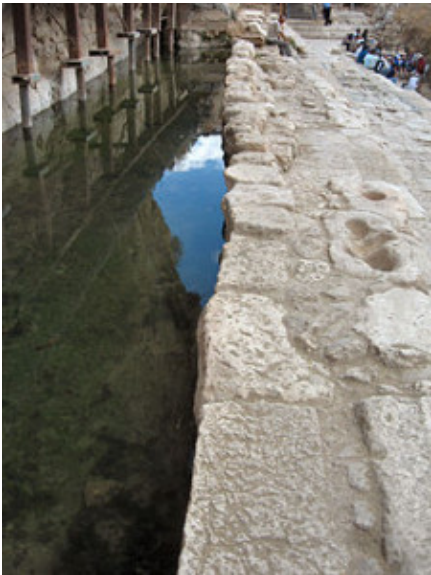
Historische poel Siloam (lager gedeelte)

noordelijk deel van de stad vlak achter de plaats waar Godfried uiteindelijk de muur bestormde, waardoor mag worden aangenomen dat ze hebben deelgenomen aan de zwaarste gevechten. 'De komst van de eerste kruistocht betekende een keerpunt in de geschiedenis van de joden in dit land,' zegt de Israëliische kruisvaartdeskundige Benjamin Kedar, hoogleraar aan de Hebreeuwse Universiteit. 'Voor de kruisvaarders,' vervolgt Kedar, 'was hier een stevig gewortelde joodse gemeenschap met eigen instituties en een behoorlijke invloed op het economische en intellectuele leven. Met de komst van de Fatimiden ging de positie van de joden geleidelijk achteruit, alhoewel er tijdens het moslim bestuur geen sprake is geweest van ernstige vervolgingen. Net al de christenen konden ze hun geloof in vrijheid belijden, maar ze waren geen volwaardige burgers en moesten belasting betalen voor de bescherming die ze ontvingen.'