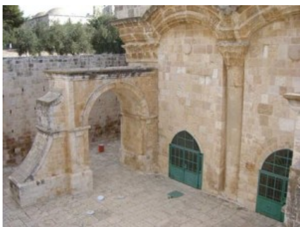
Gouden poort in Jeruzalem

Zo werd op het Tempelplein de Rotskoepel, vanwaar Mohammed op een wit gevleugeld paard ten hemel steeg, over de ruïnes van de tempel van Salomo heen gebouwd. Aan de andere kant van de westelijke muur van het Tempelplein beklagen de joden nog dagelijks het verlies van hun tempel en het noodlot dat hen dwong bijna tweeduizend jaar in de diaspora tussen de ongelovigen te leven. De begroeting 'Het volgend jaar in Jeruzalem', waarmee de verbannen joden het verlangen naar de verloren stad uitdrukten, wordt niet meer gehoord, maar de geschiedenis laat zich niet wegdrücken. Vreedzaam samenleven was in het verleden niet altijd mogelijk en het straatbeeld nu, met vele zwaar bewapende in legergroen geklede jongens en meisjes, toont dat de nieuwe heerser zich heeft voorgenomen zijn terugveroverde heiligdommen zo duur mogelijk te verkopen.