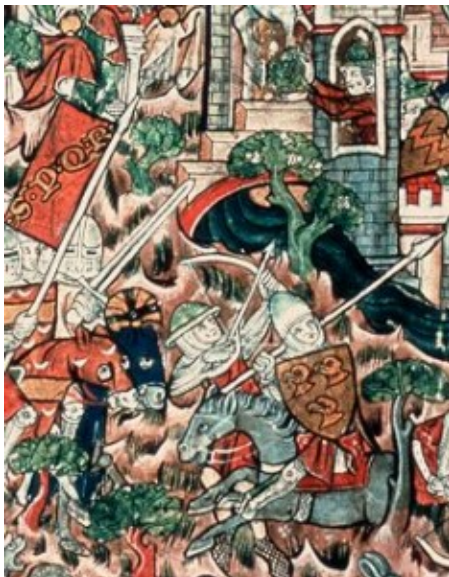
De verovering van Jeruzalem

De bovenzijde van de muur is voor toeristische wandelingen rond de oude stad opengesteld. Aan de kant van de oude stad kijkt ze uit op de vele meters lager gelegen krioelende bazar en de achtertuintjes van Palestijnse families. Aan de andere kant bevindt zich het chaotische verkeer rond het Arabische busstation bij de drukke ingang van de Damascuspoort, waar drommen toeristen na het passeren van allerlei kleine sjacheraartjes de oude stad induiken. Op dezelfde manier waarop de Palestijnen tegenwoordig met enige minachting naar het christelijke gedoe van de toeristen rond de heilige plaatsen in de oude stad kijken, scholden de moslims op vrijdag 8 juli 1099 vanaf de muren naar de zonderlinge processie, die blootsvoets en voorafgegaan door priesters en bisschoppen met