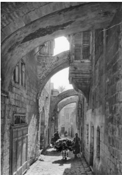
Via Dolorosa Jeruzalem

Het is dringen geblazen in de Via Dolorosa, het smalle straatje in de oude stad van Jeruzalem waar Jezus, onderweg van het huis van Pontius Pilatus naar Golgotha, zijn kruisweg met de veertien statiën even zovele keren onderbrak. Reisleiders van allerlei nationaliteiten brengen de Babylonische spraakverwarring