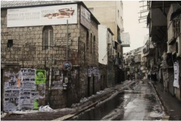
de wijk Mea She'arim

Vanaf de begraafplaats keren de joden terug naar hun eigen wijk, Mea She'arim. Het is een enclave in het centrum van de nieuwe stad, die zich laat vergelijken met een vooroorlogse Oost-Europese sjtetl: een stadsdeel vol traditionele Asjkenazische en ultra-orthodoxe Chassidische joden die alleen het koninkrijk Gods erkennen en daarom de staat Israëel afwijzen. Er heerst een sfeer van eeuwen geleden. Vrouwen en meisjes met enkellange rokken, lange mouwen en het haar boven de bleke gezichten afgedekt met pruiken en hoedjes, schuifelen met krakkemikkige kinderwagens langs de huizen. De kleine straatjes zijn gevuld met Judaïcawinkeltjes, streng kosjere eethuisjes, tientallen synagogen en thora-scholen. Een groepje ongeveer twaalf jaar oude jongetjes wacht onder toezicht van de vaders hun beurt af bij een kapper, die volgens het voorgeschreven regime voorzichtig met zijn schaar om de lange haarlokken heen manoeuvreert. Aan de straatmuren hangen pamfletten waarop de bewoners de - buitenlandse - bezoekers oproepen zich decent te kleden en de Thora (de vijf boeken van Mozes) en de lokale vrouwen en meisjes te eerbiedigen.