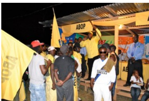
Brunswijk - verkiezingsbijeenkomst - 2010

De aanduiding van Brunswijk als een Surinaamse, zwarte Robin Hood was in Nederlandse media in die eerste week na de overvallen op militaire posten in Oost-Suriname populairder dan de vergelijking met Boni. Vóór de overvallen op Stolkertsijver en Albina in de nacht van 21 op 22 juli waren Brunswijks acties al geïnterpreteerd als een 'guerrillastrijd' . In de Leeuwarder Courant van 27 mei 1986 - die zich baseerde op GPD- en ANP-berichten - werd Brunswijk aangeduid als een 'gedeserteerde' sergeant die sinds april een guerrilla-oorlog tegen het Bouterse-regime voerde. Het was de Raad voor de Bevrijding van Suriname van wie de informatie klaarblijkelijk afkomstig was. Het is twijfelachtig of de acties van Brunswijk op dat moment als zodanig geïnterpreteerd moeten worden. Was er niet eerder sprake van een 'wraakmotief' en deed niet pas later een politiek motief, herstel van de democratie, zijn intrede (Volker 1998:166)? In het interview dat ik met hem had zei Brunswijk letterlijk, dat het Surinaams verzet hem vroeg de democratie te helpen herstellen. Edwin Marshall, die ook betrokken was bij het Surinaams verzet, bevestigde tegenover mij: 'In 1985 begon Brunswijk hier en daar met overvalletjes; hij deelde geld uit. Er was toen nog geen sprake van een ideologische strijd' (De Vries 2005:16, 20).'