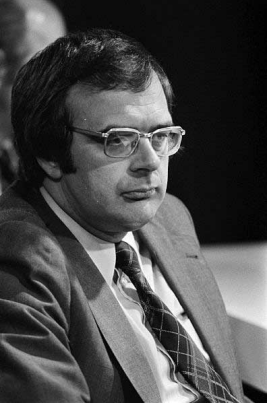
Minister Jan Pronk