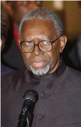
President Ronald Venetiaan