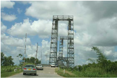
Brug bij Nickerie