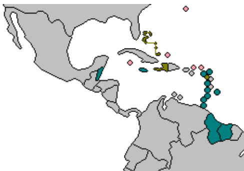
CARICOM Single Market and Economy

Bij de definiëring van gemeenschappelijke doelstellingen zullen Nederland en Suriname zich er terdege rekenschap van moeten geven dat veranderingen, die zich sinds 1975 in de wereld voordoen, daar voldoende bij worden betrokken. Vanuit de Surinaamse optiek zijn vier mondiale ontwikkelingen uitermate relevant.