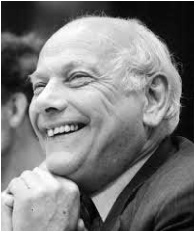
Premier Joop den Uyl

geconstateerd worden dat ook in 1998 nog nauwelijks sprake is van het kunnen inzetten van eigen (...) deskundigen. De situatie is in feite weinig gewijzigd. Er zijn ook nu slechts een 20 tal academici dan wel HBO-ers beschikbaar op een totaal personeelsbestand van rond 2350. De conclusie is dan ook gerechtvaardigd, dat wil de geplande uitvoering van het Herstelprogramma Infrastructuur I, periode 1998 - 2001, op een verantwoorde wijze en tijdig tot stand komen, een team van 4 deskundigen beschikbaar moet blijven.