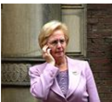
Minister Agnes van Ardenne

Partijen zullen bij de inkleuring uiteraard de lessen uit het verleden ter harte moeten nemen. Maar de inkleuringsexercitie zelf heeft alleen zin indien partijen bereid zijn een aantal beginselen te onderkennen, onderschrijven en in acht te nemen. Het zijn beginselen die betrekking hebben op hun (mede)verantwoordelijkheid voor een betere toekomst van Suriname, de legitimiteit van hun speciale relatie, de billijkheid van veranderingen die zij beogen en op de doelmatigheid van de wijze waarop zij in de toekomst aan hun relatie uitvoering willen geven. Dat zijn beginselen waarvan de toepassing leidt tot een speciale hulprelatie waarin Nederland en Suriname doen wat zij voor de toekomst aan elkaar verplicht zijn om de potentiële meerwaarde van hun onderlinge betrokkenheid te realiseren.