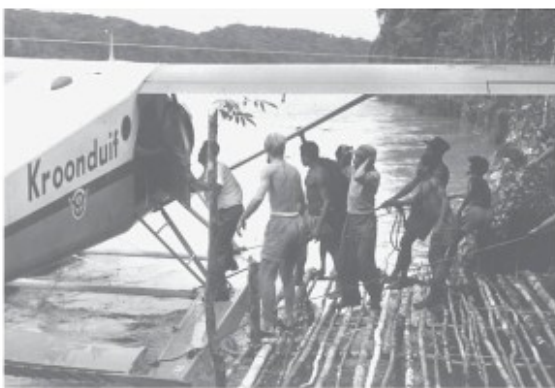
Landing op de Idenburgrivier