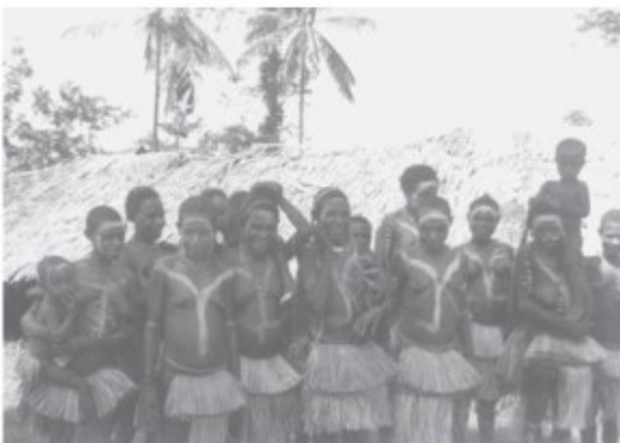
Feestelijk uitgedoste gasten