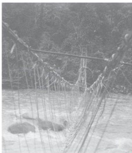
Rotanhangbrug over de Digoel rivier (Ok Tsjiap)

Op de plaats waar de Digoel in een nauwe kloof duikt gaat de expeditie de berghelling op. De stijging is in twee uur tijd 450 meter en eindigt in een droog dal, het begin van het karstgebied. De kenmerken van de kalksteen, doorlatendheid en een onregelmatig gevormde bodem manifesteren zich heel direct. Er is nauwelijks meer (drink) water te vinden en de scherpe stenen zijn pijnlijk voor de voeten van de dragers. Maar gelukkig komen we steeds dichterbij het einddoel. Er volgt nog een flinke klim naar het dorpje Ariemkop, een idyllisch plaatsje aan de voet van een bergrug. De paden zijn met gras begroeid en de huizen staan in groepjes verspreid. Tegen de berghellingen liggen de tuinen en hekwerken houden erosie tegen.