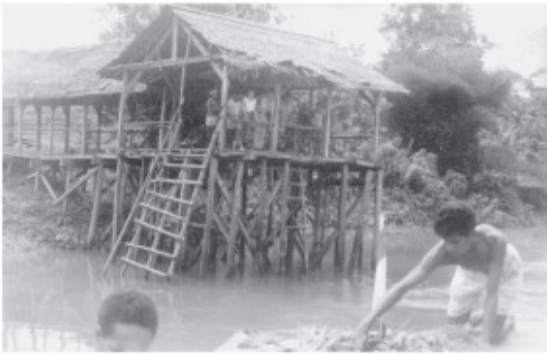
Aanlegsteiger in de Kao-rivier