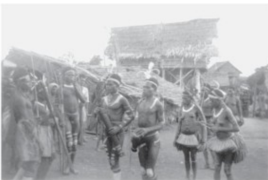
Binnenkomst trommelende gasten

Ook voor ons wordt het tijd de terugweg te aanvaarden en na de feestgever een pluim te hebben gegeven voor de organisatie laten we Koteremko achter ons met een 'voldaan' gevoel. We steken de kali Kao over ter hoogte van Woropko. Het overzetten gebeurt hier met een tweelingprauw en gaat zo iets sneller dan op de heenweg. Het valt op dat de bevolking hier nog altijd bezig is om de Kamkaweg, die vanaf Mindiptana tot hier loopt, verder door te trekken. Bij de zaagstelling ligt een voorraad hout gereed voor transport naar Mindiptana. Men wacht nog steeds op de komst van het bestuur, dat wil zeggen op de opening van de Districtspost Woropko; de terreinen voor de op te zetten gebouwen liggen al lang gereed. Wat me ook opvalt is dat de regengmeter steeds voller wordend staat te wachten tot de onderwijzer terug komt van vakantie om hem af te tappen, terwijl zoiets toch gewoonlijk dagelijks moet gebeuren. De volgende dag zijn we weer terug in Mindiptana.