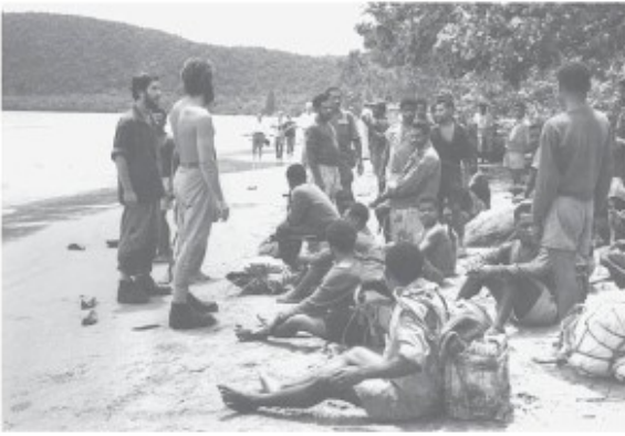
Dragers bij de zee