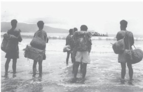
Dragers bij de zee