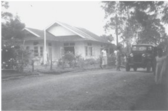
Woning van de HPB in Mindiptana

In de meeste dorpen is door de bewoners een pasanggrahan gebouwd. Het is een doorgangshuis voor bezoekers, meestal een grote vierkante ruimte met een atap of bladerdak en een wand van de bladnerven van de sagogpalm (gabagaba). Met een beetje geluk staat er een bed, een tafel en een stoel, maar vaak ontbreekt dit meubilair. Het dak lekt bijna altijd. Men is namelijk gewend om het dak pas te repareren wanneer de bestuursambtenaar komt, maar dan is het dus meestal te laat.