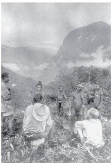
Bergbewoners met 'hun' eerste blanke bezoekers

Ook wij moeten weer verder en toevallig in dezelfde richting als hij. Uit een smal rivierdal omhoog klimmend, meent Kotanon op een plateau een hinderlaag van met pijl en boog klaarstaande bewoners te ontdekken. Wij zijn natuurlijk niet uit op een confrontatie en blijven daarom overnachten op de smalle oever van het rivierdal.