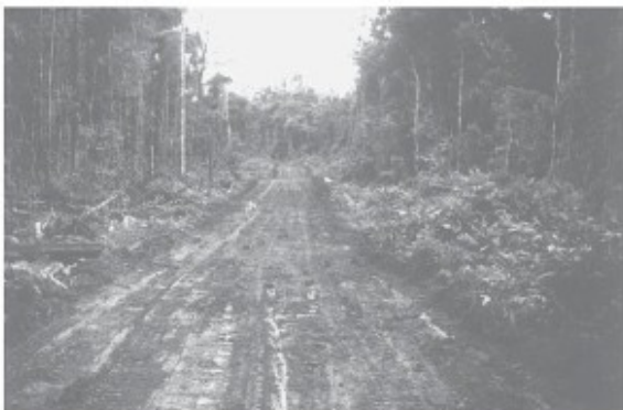
De Kamkaweg tussen Mindiptana en Waropko

De boomstammen over kleine riviertjes zijn door het vocht uitermate glibberig. De dragers, die op blote voeten lopen, hebben met hun tenen beter houvast dan degenen die op schoenen lopen. Daarom trekken de Papoea politieagenten soms hun kistjes een poosje uit. De Europeanen glijden er zo goed mogelijk overheen. De dragers hebben het trouwens niet gemakkelijk; voor sommigen zijn de vrachten te zwaar of ligt het tempo te hoog. Het komt voor, dat dragers spoorloos verdwijnen of dat zij zich ziek melden. Die laatsten gaan dan terug en nieuwe dragers worden gerekruteerd in de dorpen langs de route. In de dorpen Tawenokpit, Tumutu en Kwitbon wordt overnacht, waarna aan de noordgrens van het Mujugebied Ikjan wordt bereikt, het laatste dorp in bestuurd gebied bereikt.