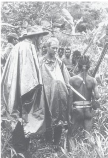
Deloye en Sneeep met gewapende bewoners

van mannen, vrouwen en kinderen. Uit de omliggende tuinen keren de mensen terug naar hun huizen en weldra zien we gewapende mannen het dorp afsluiten. Zij willen waarschijnlijk eerst afwachten wat wij zullen doen, maar ze zijn ongetwijfeld al door de mensen uit het vorige dorp van onze komst op de hoogte gesteld. Op enige afstand van het dorp vinden we een goede plaats voor ons bivak en terwijl we dat aan het inrichten zijn komen nieuwsgierige mannen langzaam dichterbij. Wij gebaren dat ze gerust in het bivak kunnen komen kijken, waarop één man uit het groepje ons een stenen bijl aanbiedt. Wanneer hij in ruil hiervoor een kapmes heeft gekregen is het ijs gebroken en komt de hele groep ons bivak binnen. In uiterlijk, 'kledij' en bewapening verschillen deze vriendelijke mensen niet opvallend van de Sibillers. Misschien zijn ze wel iets kleiner dan de gemiddelde Sibiller.