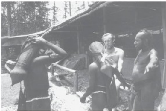
Sibillers met kleiknotsen en kettingen van hondentanden

Overige rituelen tijdens de initiatieperiode zijn niet zo bekend. Het doorboren van het neustussenschot kan bijvoorbeeld op elk gewenst moment gebeuren. Deze operatie houdt in dat een aangescherpte splinter van de niboengpalm na verhitting door het tussenschot wordt gestoken. Na enige tijd wordt de operatie herhaald met een steeds dikker stuk niboeng, totdat het gat zo groot is dat er de ader van een steen, een stuk bamboe of een varkenstand door kan worden gestoken. Sommigen haken vanwege de pijn af na de eerste operatie.