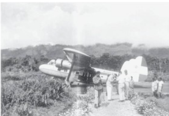
De eerste landing van de Twin Pioneer

De hele maand juli staat in het teken van de vliegerij en van zware bewolking met soms hevige regenval - op een etmaal meten we 103 mm, ongeveer een zevende van wat in Nederland in een jaar valt - afgewisseld met stralend zonnige dagen; allemaal factoren die bepalen of er al of niet kan worden gevlogen. Wanneer de Dakota uit Merauke vanwege het dichte wolkendek vlak voor de Sibil moet terugkeren, gaan verschillende levensmiddelen weer op rantsoen. Wel landt de Cessna een paar maal met wat noodvoorraden en een keer met twee vliegvelddeskundigen die tot ons grote genoegen de landingsbaan goedkeuren voor de grotere Twin Pioneer, een dubbeldekker die niet alleen een flinke lading kan vervoeren maar ook op korte veldjes als het onze kan landen. De restrictie is wel dat bij meer dan 10 mm neerslag in een etmaal de Twin niet mag landen. Maar het resultaat van een gulle bui bij ons is al snel meer dan die hoeveelheid!