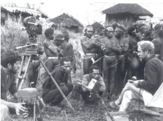
Samen met De Maigret aan de radio

Op 31 januari kunnen we de vloten gaan beladen en bemannen. Als het eerste vlot naar de 'laadplaats' wordt gesleept gaat er weer eens wat mis. Op de oever laat men de touwen schieten waarmee het vlot wordt verhaald, waarna het door de stroom wordt meegevoerd. De drie dragers op het vlot doen met hun peddels vergeefse pogingen om de kant te bereiken. In de verte verdwijnen ze om een bocht. Dat is dus geen goed