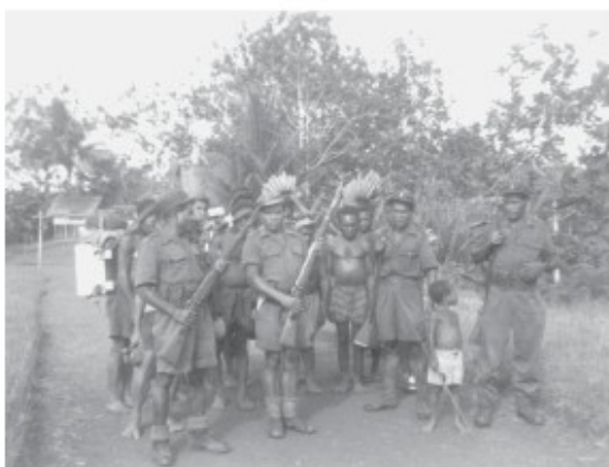
Politie-escorte en dragers