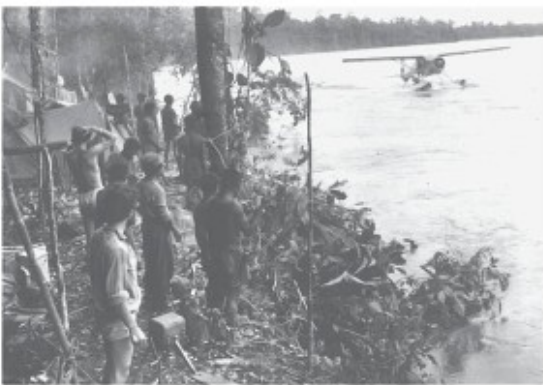
Landing op de Idenburgrivier

gevoel enige bekendheid te genieten door dat gezwoeg over het eiland. Twee Papoea-verpleegsters komen met een brancard aangelopen, maar na de lange tocht van de afgelopen maanden lijkt het me wat al te gek om daar nu op te gaan liggen. Ik leg er dus m'n schamele bagage op en loop met de dames mee naar de isolatie-afdeling Pasteur (voor besmettelijke ziekten!) waar mij een mooie kamer wordt toegewezen. Ik moet daar net zo lang blijven totdat m'n bloed, dat regelmatig wordt gecontroleerd, weer in orde is. Over belangstelling heb ik niet te klagen. Hoewel ik zogenaamd geïsoleerd lig, lopen de bezoekers zonder problemen in en uit.