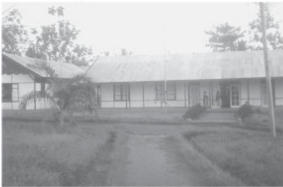
Het ziekenhuis in Mindiptana

Via de radio is er regelmatig contact met Hermans in de Sibilvallei in het noordelijk gelegen Sterrengebergte. Wij zijn een tussenschakel tussen hem en Merauke, vooral als er een dropping bij hem moet plaatsvinden en de rechtstreekse verbinding slecht is. Hij is druk bezig met de aanleg van een vliegveldje en zolang dat nog niet klaar is, is hij volledig afhankelijk van bevoorrading door middel van droppings. Onze post wordt bevoorrad over water met de lichters. Dat lijkt eenvoudiger, maar deze wijze van foerageren stagneert ook nog wel eens als gevolg van defecte motoren of te lage waterstand.