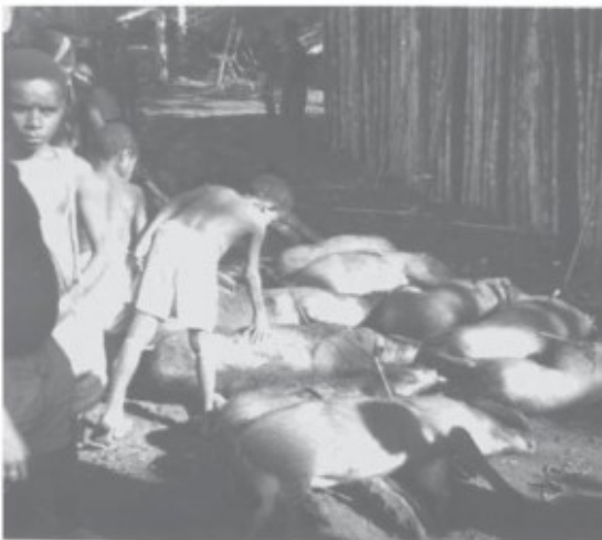
31 varkens op een rij

Op nieuwjaarsmorgen omstreeks 4.00 uur is het gedaan met de nachtrust wanneer de Awon Kombon - dit zijn degenen die bij de feestgever vlees hebben besteld en met het doodpijlen van de varkens zullen helpen - ketmon dansend het dorp binnenkomen. De ketmon is een dans waarbij men achter elkaar dravend een hoge fluittoon laat horen die veroorzaakt wordt door het opzuigen in plaats van het uitblazen van lucht tussen de lippen. Tegelijk maakt men met pijl en boog een kletterend geluid, doet men alsof men schiet. Plotseling wordt zo'n 'run' onderbroken door een gemeenschappelijke schreeuw om na een korte pauze weer dezelfde handeling uit te voeren, op die manier het doel steeds meer naderend. Vanaf 4.30 uur klinkt een eentonig gezang waarin men voornamelijk zinspeelt op het vlot toestromen van veel ots. Het gezang stopt als het begint te dagen en het tijd wordt om de varkens te gaan pijlen.