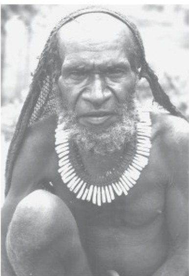
Wasojim, de bewaker van