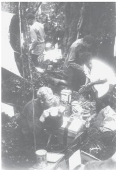
In het mosbos

Iedereen zou moeten kunnen genieten van het prachtige uitzicht bij ondergaande zon, maar dat plezier wordt enigszins getemperd door het feit dat er nergens water te bespeuren valt. Er kan dus niet worden gekookt en met knorrende magen moeten we onder de heldere sterrenhemel de zonsopgang afwachten. Daar komt bij dat het op 1440 meter ook al aardig frisser is dan we de afgelopen tijd gewend zijn geweest. Aan de twee schriële boompjes langs het pad hangt Dominicus in het schemerdonker mijn hangmat op, waarover ik als enige beschik. Ik verkeer hier wel in een heel comfortabele positie nu de anderen een plekje op het harde pad moeten zoeken. Maar als ik de volgende morgen aan één kant van de hangmat door het muskietengaas naar beneden kijk en ontdek dat ik de hele nacht boven een ravijn heb liggen schommelen bedenk ik dat comfort soms ook z'n bezwaren kan hebben.