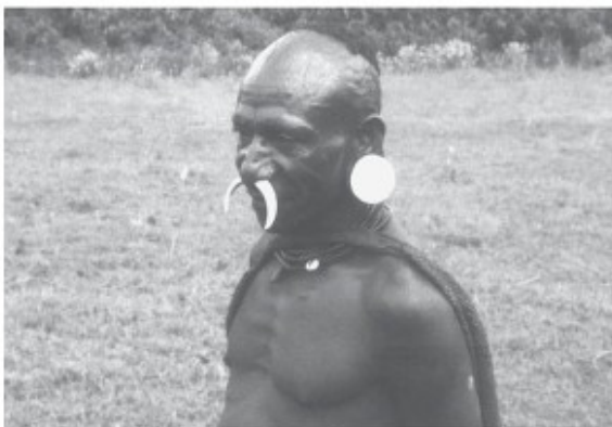
Sibiller met varkensslagtanden door