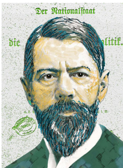
Max Weber - Illustration by Ingrid Bouws

The state of the art of the social sciences at the end of the sixties of the past century was characterized by a strong mood of optimism.