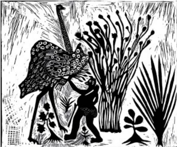
Thamae Kaashe - Ostrich and fire