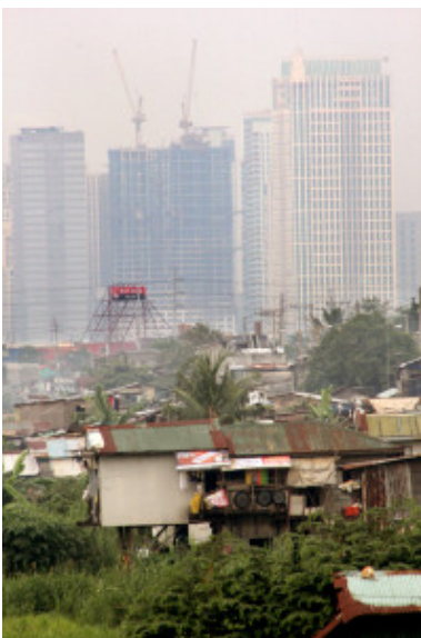
An urban poor