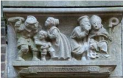
Console bisschop Koenraad van Zwaben Console Wittebroodskind