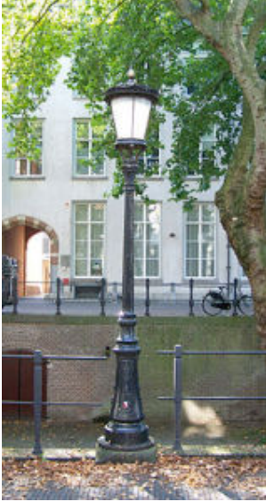
Straatlantaarn aan de Utrechtse Nieuwegracht met een lampenkap naar ontwerp van Koch

De lantaarnpalen kragen iets uit over de werfmuren langs de grachten opdat zowel de straat als een deel van de werf daaronder worden verlicht. Er ontstond dus ruimte om aan de werfkant onder de palen consoles aan te brengen. Dat bracht Willem Stoker, toenmalig hoofd Monumenten bij de Dienst Openbare Werken, op de lumineuze gedachte Utrechtse beeldhouwers te vragen om op de consoles beeldhouwwerken aan te brengen die verwijzen naar vermaarde Utrechtse personen en betekenisvolle gebeurtenissen uit de geschiedenis van de stad. In 1953 werd ter hoogte van Oudegracht 165a de eerste gebeeldhouwde console - het Utrechtse stadswapen - aangebracht.