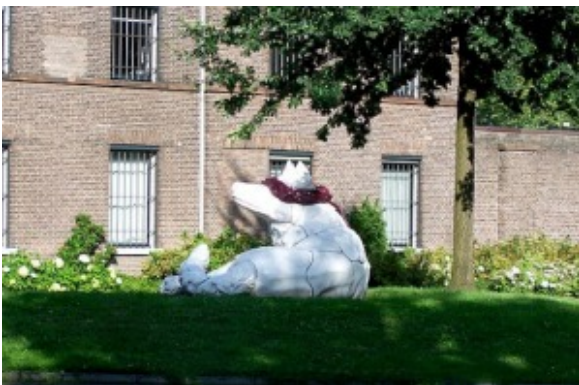
Suzanne Willems - De geblinddoekte witte wolvin onder de eik

Floris, op valkenjacht, werd buiten Utrecht overvallen en gedood door wraakzuchtige mannen uit het leger van Herman en Godfried van Cuijk. Zonder die kop aan het pand Mariaplaats 17 zouden in Utrecht verhalen over deze Floris allang verstomd zijn. Mooie verhalen over een Kaïn- en Abelachtige broedertwist, nu met een moeder in de coulissen, en de schande van een geweigerde bruid.[13]