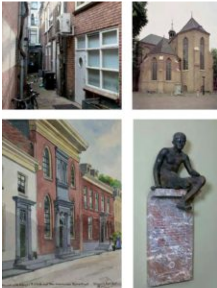
Jodenhofje Pieterskerk Schuilkerk in de Herenstraat Beeldje Academiegebouw, verbrande Hermes