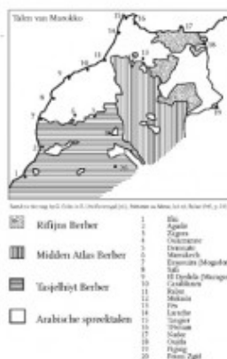
TALLEN VAN MAROKKO.