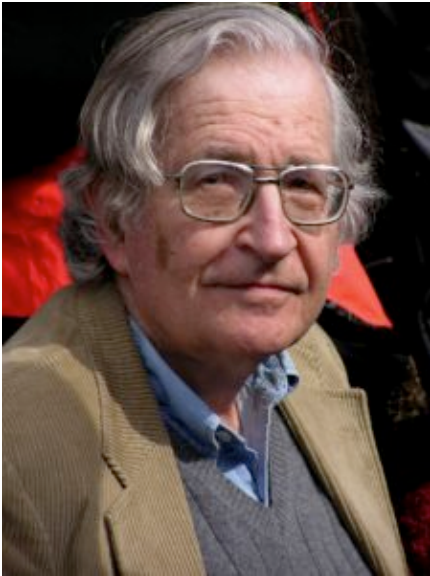
Noam Chomsky

President Trump's sudden cancellation of the upcoming denuclearization summit with North Korean leader Kim Jong Un is just the latest example of Trump's wildly erratic approach to foreign policy.