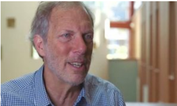
Prof.dr. Robert Pollin

Is fossil fuels divestment an effective strategy in tackling climate change? A newly released study by the Political Economy Research Institute (PERI) at the University of Massachusetts at Amherst suggests that this strategy is not sufficient on its own in affecting the global battle against climate change and that new approaches are needed. Robert Pollin, a distinguished professor of economics at the University of Massachusetts, Amherst, co-director of PERI and co-author of the study spoke to C.J. Polychroniou about the limits of the movement to divest from fossil fuels and the need for fresh approaches and a more holistic type of action for combatting climate change.