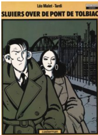
Jacques Tardi, Sluiers over de Pont de Tolbiac, 1982