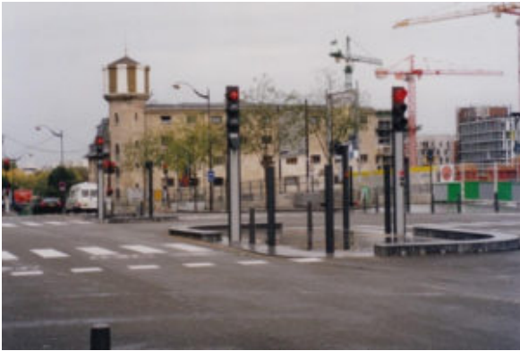
Plaats delict, ca. 2010

Terug naar de Pont de Tolbiac. De exacte plek waar in het boek van Malet de overval op de geldloper heeft plaatsgevonden, is lastig te bepalen. De tekeningen van Jacques Tardi brengen uitkomst, maar de plek is onherkenbaar veranderd. Maar nee, niet helemaal. In de schaduw van de Bibliothèque National staat nog, met haar onmiskenbare watertoren, het koelhuis van de Entrepôts Frigorifiques, waarvoor de overvallen geldloper werkzaam was. Het werd in de jaren tachtig gekraakt, is inmiddels gelegaliseerd en is verbouwd tot ruimtes voor kunstenaarsateliers en artistieke bedrijfjes. Het is één van de laatste restjes vooroorlogs 13e Arrondissement.