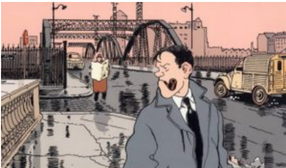
Jacques Tardi, Nestor Burma op de Pont de Tolbiac

De Franse schrijver Léo Malet (1909-1996) schreef in de jaren veertig, vijftig en zestig tientallen detectiveromans. Na Georges Simenon was hij de best verkochte detectiveschrijver in Frankrijk. Voor de Tweede Wereldoorlog was hij actief als anarchist en betrokken bij de surrealistische beweging rond André Breton. Zijn bekendste boek is Brouillard au Pont de Tolbiac (1956), wat zich afspeelt in het 13e Arrondissement in Parijs. Wie in het voetspoor van Malet de wijk wil doorkruisen, treft een stadswijk aan die in ruim een halve eeuw tijd enorm van karakter is veranderd. De vraag is of dat allemaal ten goede is.