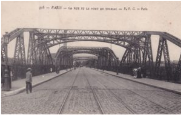
Pont de Tolbiac, ca. 1910

De Franse schrijver Léo Malet (1909-1996) schreef in de jaren veertig, vijftig en zestig tientallen detectiveromans. Na Georges Simenon was hij de best verkochte detectiveschrijver in Frankrijk. Voor de Tweede Wereldoorlog was hij actief als anarchist en betrokken bij de surrealistische beweging rond André Breton. Zijn bekendste boek is Brouillard au Pont de Tolbiac (1956), wat zich afspeelt in het 13e Arrondissement in Parijs. Wie in het voetspoor van Malet de wijk wil doorkruisen, treft een stadswijk aan die in ruim een halve eeuw tijd enorm van karakter is veranderd. De vraag is of dat allemaal ten goede is.