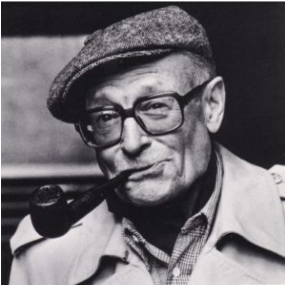
Léo Malet (7 maart 1909 - 3 maart 1996)

als chansonnier in tweederangs theatertjes in Montmartre. Hij begon surrealistisch getinte teksten te schrijven en maakte surrealistische erotische kunst. Hij stuurde een gedicht naar André Breton, de voorman van de surrealistische beweging en uitgever van het tijdschrift La Révolution Surréaliste . Breton nodigde Malet uit zich bij de groep aan te sluiten. In 1936 publiceerde Malet zijn bekendste surrealistische gedicht Ne pas voir plus loin que le bout de son sexe .