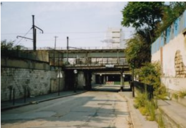
Rue Watt, ca. 2012

Terug naar de Pont de Tolbiac. De exacte plek waar in het boek van Malet de overval op de geldloper heeft plaatsgevonden, is lastig te bepalen. De tekeningen van Jacques Tardi brengen uitkomst, maar de plek is onherkenbaar veranderd. Maar nee, niet helemaal. In de schaduw van de Bibliothèque National staat nog, met haar onmiskenbare watertoren, het koelhuis van de Entrepôts Frigorifiques, waarvoor de overvallen geldloper werkzaam was. Het werd in de jaren tachtig gekraakt, is inmiddels gelegaliseerd en is verbouwd tot ruimtes voor kunstenaarsateliers en artistieke bedrijfjes. Het is één van de laatste restjes vooroorlogs 13e Arrondissement.