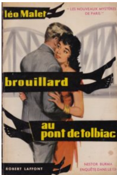
Léo Malet, Brouillard au Pont de Tolbiac, 1956

Burma is tegen het gebruik van geweld, maar anderen menen dat geweld niet kan worden uitgesloten. De overval op de geldloper bij de Pont de Tolbiac is het gevolg. Wanneer Burma zich twintig jaar later op de oude zaak stort, lijkt een confrontatie met vroegere kameraden onvermijdelijk.