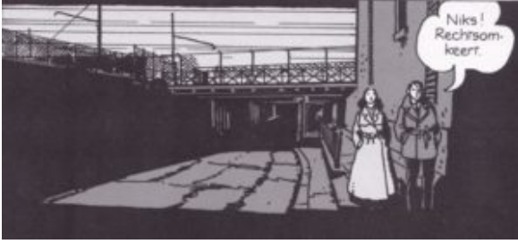
Jacques Tardi, Rue Watt