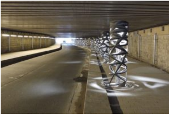
Rue Watt, 2019