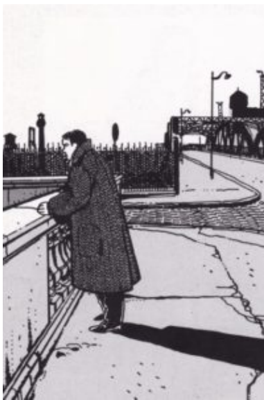
Jacques Tardi, Nestor Burma op de Pont de Tolbiac

In deze roman wordt privédetective Nestor Burma - voormalig anarchist - twintig jaar later door een oude kameraad getipt over de zaak van de beroofde geldloper. Burma verdiept zich in de zaak en wordt vervolgens geconfronteerd met zijn anarchistische verleden, met personen en gebeurtenissen die hij al lang had verdrongen.