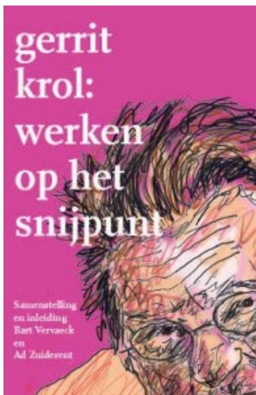
Tekening en omslag Ingrid Bouws

In de inleiding op zijn roman Omhelzingen vertelt Gerrit Krol over zijn ontmoeting met een Poolse filmer die van plan was een film te maken op basis van Nietzsches idee van de eeuwige terugkeer der dingen. Een ambitieus project, vindt Krol, want dan zal hij niet alleen de ruimte steeds moeten laten terugkeren, maar ook de tijd.