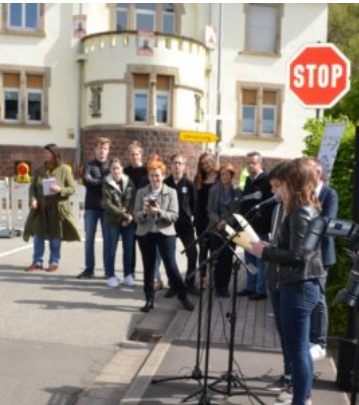
Scholieren van het Siebenpfeiffer Gymnasium Kusel