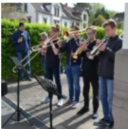
Scholieren van het Siebenpfeiffer Gymnasium