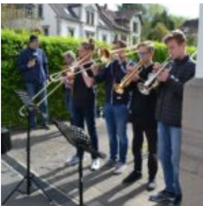
Scholieren van het Siebenpfeiffer Gymnasium Kusel