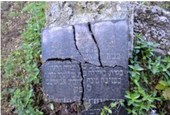
Grafsteen van de familie Bermann op de Joodse begraafplaats in Kusel