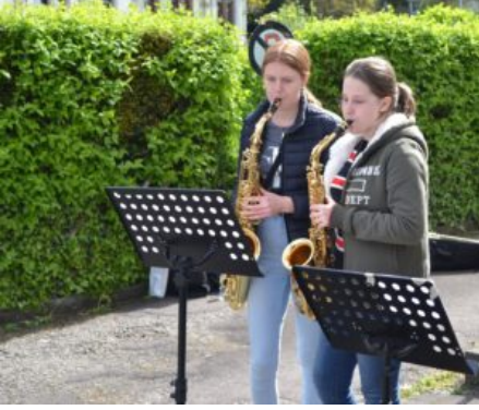
Scholieren van het Siebenpfeiffer Gymnasium Kusel