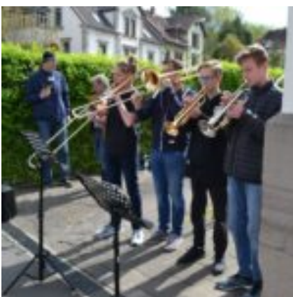
Scholieren van het Siebenpfeiffer Gymnasium Kusel