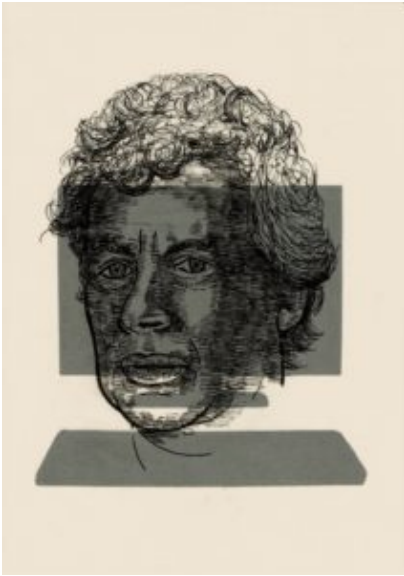
Alessandro Baricco.

Alessandro Baricco onderzoekt in The Game , opvolger van zijn zeer succesvolle boek De Barbaren' [zie video onder artikel], de digitale revolutie en de gevolgen daarvan op onze beschaving. Deze revolutie heeft onze manier van denken en leven voorgoed veranderd. Maar lopen we niet het risico onze menselijkheid te verliezen in het digitale tijdperk? Waar en wanneer begon deze transformatie en waarheen leidt die ons?