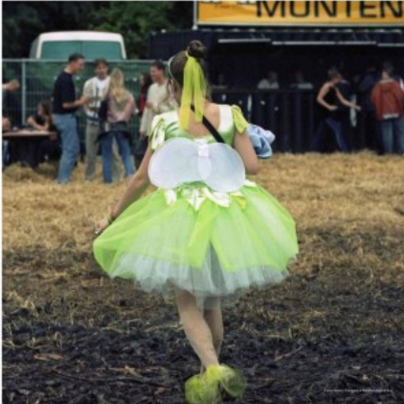
Amsterdamse Bos

De 'freaks' - als ze er bij de voordeur door portiers al niet zijn uitgefilterd - vallen eerder op, juist omdat het er nog zo weinig zijn in een door H&M en consorten gedomineerde smaakcultuur waarvan het meest opvallend nog de modieuze eenvormigheid is. Culturele rumoermakers hebben in de afgelopen jaren tandenknarsend moeten toezien hoe de feestbarometer is gezakt naar wat zij beschouwen als een lagedrukgebied van saaie en brave vrolijkheid. In deze kringen wordt geageerd tegen de 'vertrutting' van Amsterdam, de strengere regelgeving en het zerotolerancebeleid, maar zij lijken (vooralsnog?) roependen in de woestijn.