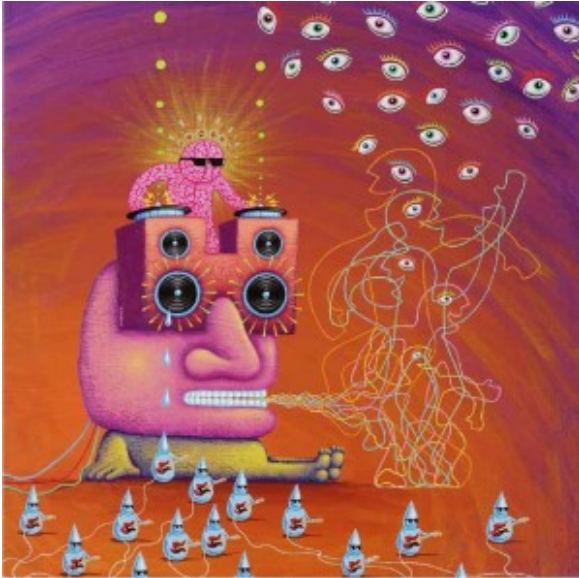
Illustratie Dadara • Brain DJ