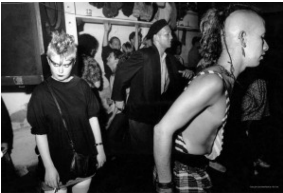
Disco de Trut. Zondag 7 mei 1989