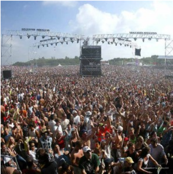
Dance Valley 2003