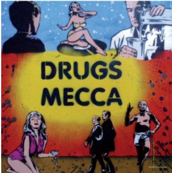
Illustratie Hugo Kaagman

Door de snelle opkomst van ecstasy in de late jaren tachtig en de verschijning van nieuwe synthetische drugs, psychedelische paddo's en narcosemiddelen in de jaren negentig, is de drugsmarkt net als de drugsconsumptie complexer geworden (Nabben & Korf, 1997; Korf & Nabben, 1997, 2000; Parker et al., 1998). Op het ritme van house verspreidde de nieuwe feestcultuur zich als een veenbrand over Amsterdam.