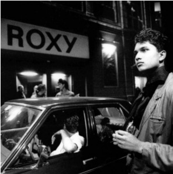
RoXY 16 juli 1989