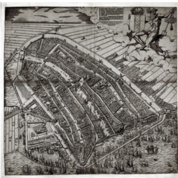
Vogelvluchtkaart van Amsterdam door Cornelis Anthonisz, 1544

De houtsnede van Cornelis Anthonisz uit 1544 is de op één na oudste kaart van Amsterdam. De stad is nog omsloten door de middeleeuwse muur, versterkt met torens en poorten. Voor de muur loopt een brede gracht: de tegenwoordige