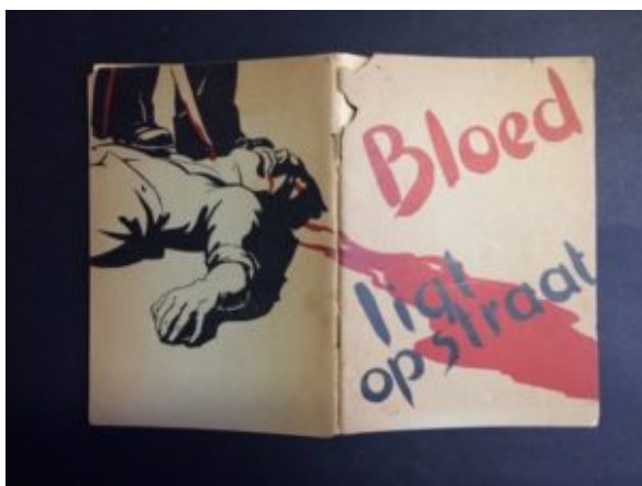
Poëziebundel van Henk Eikeboom

Een van de meest spraakmakende acties waaraan Eikeboom deelnam was de oprichting van de Rapaillepartij . Samen met de dadaïst Anthon Bakels en kunstenaar Erich Wichman richtte Eikeboom een politieke partij op, juist om aan te tonen dat het algemeen kiesrecht nergens toe leidt en om de opkomstplicht aan de kaak te stellen. Ook wilden ze de vraag aan de orde stellen of de massa in Nederland wel een juiste politieke keuze kon maken. Lijsttrekker werd de Amsterdamse zwerver Hadjememaar, die tot ieders verrassing in de Amsterdamse gemeenteraad werd gekozen. Na één raadsvergadering hief de partij zich op.