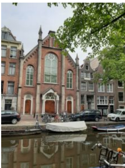
Hersteld Apostolische Zendingkerk – Stam Juda, Bloemgracht, Amsterdam