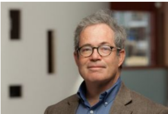
Prof.dr. Gerald Epstein

Public education in the U.S. has been under severe attack for many years now, thanks to the dominance of neoliberal thinking and policies across the societal spectrum. However, the coronavirus pandemic has sparked a new crisis in the nation's public education system as a result of having created huge holes in school budgets, especially in high-poverty areas. Yet, there are ways to prevent the collapse of the public education system in the U.S., if there is a will to do so. And the rescue can come directly through the power of the Federal Reserve, according to leading progressive economist Gerald Epstein, professor of economics and co-director of the Political Economy Research Institute at the University of Massachusetts at Amherst. In this exclusive interview for Truthout , Epstein discusses how the COVID-19 crisis has exacerbated funding deficits for public education and how the Federal Reserve can step in to save schools.