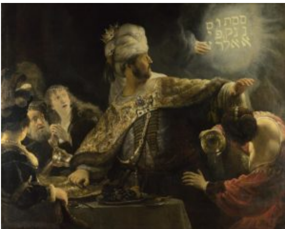
Rembrandt van Rijn - Het feestmaal van Belsazar (circa 1636-1638)

Ik kan die uitdrukking nooit lezen zonder onmiddellijk te denken aan een anekdote over de Amerikaanse schrijfster Dorothy Parker, die eens gelijktijdig met een aanzienlijk jongere collega een deur naderde waar maar één van hen tegelijk door kon. De jongste hield haar pas in, zeggend 'Age before beauty' . Parker nam meteen de uitnodiging aan, onder de woorden 'Pearls before swine' .