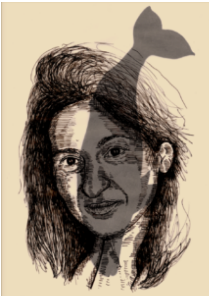
Minouche Shafik

‘Wij hebben een nieuw sociaal contract nodig dat beter in elkaar zit, dat zekerheid en kansen biedt voor iedereen. Een sociaal contract dat minder gaat over ‘mij’ en meer over ‘wij’, dat onze onderlinge afhankelijkheid onderkent en daar tot ons wederzijds profijt gebruik van maakt.’