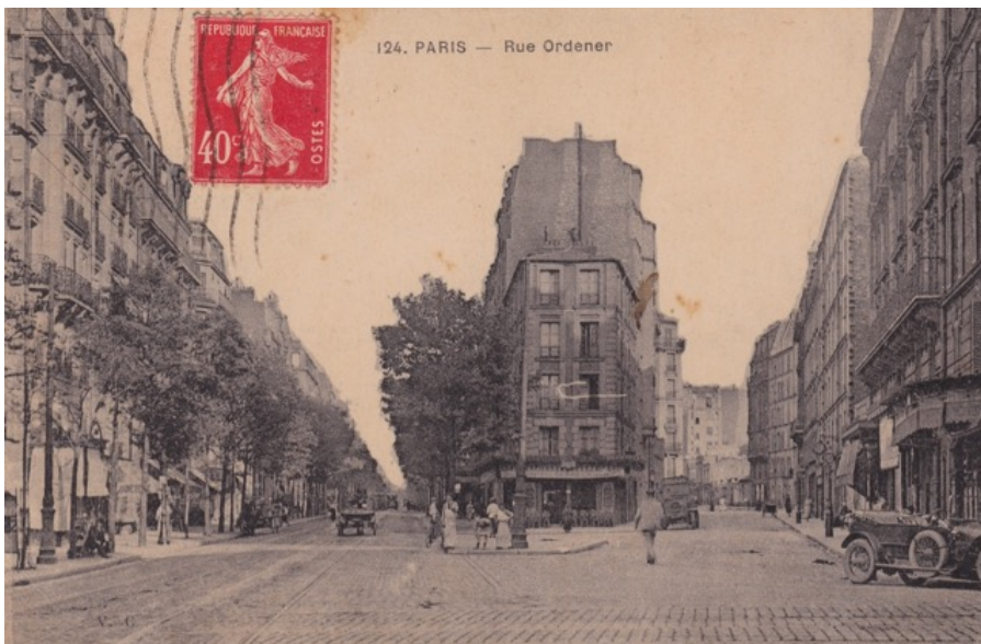
Rue Ordener, Parijs ca. 1911. Bonnot draaide van de Rue Ordener (links), rechts de Rue du Cloys in

Op 21 december 1911 vond in Parijs de eerste bankoverval in de geschiedenis plaats waarbij gebruik gemaakt werd van een auto. De daders waren vier mannen die deel uitmaakten van een groep anarchistenvan die door middel van overvallen de bourgeoisie in haar hart wilde treffen. In 1911 en 1912 zaaide de bende paniek in Parijs en omstreken met een serie spectaculaire en gewelddadige overvallen waarbij ze gebruik maakte van auto's. In een tijd dat de ongewapende Franse politie zich nog per fiets verplaatste, was dat op z'n minst baanbrekend te noemen. De geschiedenis van deze Autobandieten, oftewel de Bende van Bonnot zoals de groep genoemd werd, is meerdere malen beschreven.[1] Hierin wordt echter weinig aandacht geschonken aan de autotypes die door deze Autobandieten voor hun acties werden gebruikt. Maar voor de leden van de groep was juist het weloverwogen uitzoeken van een bepaald automerk en type een essentieel onderdeel van hun wijze van opereren.