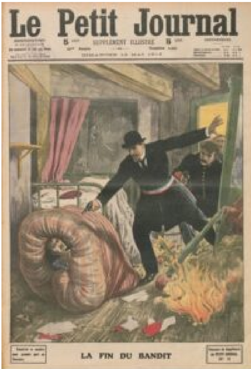
De dood van Bonnot

bovendieping van een garage in Choisy-le-Roi. Wat volgt is een belegering van ongekende proporties. Ruim vijfhonderd bewapende mannen - republikeinse garde, gendarmes en bewapende burgers - omsingelen het gebouw. Na een langdurig vuurgevecht sterft Bonnot.[6]