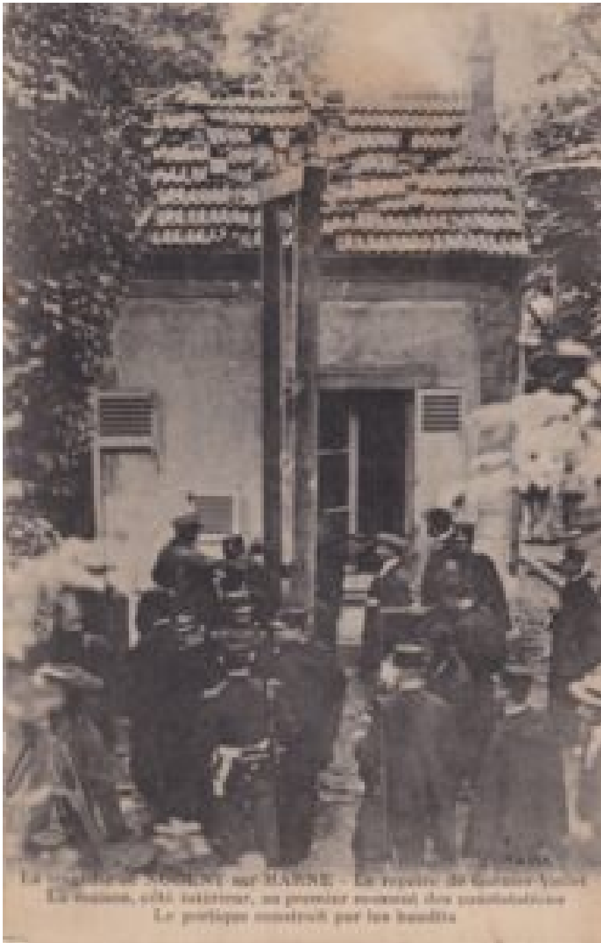
Het huisje waar Valet en Garnier zich hadden verschanst

Twee weken later volgt een soortgelijke belegering in Nogent-sur-Marne, een voorstadje van Parijs. Garnier en Valet hebben zich daar verschanst in een vakantiewoning, omsingeld door honderden gendarmes en legertroepen. De woning wordt gedeeltelijk aan puin geschoten.