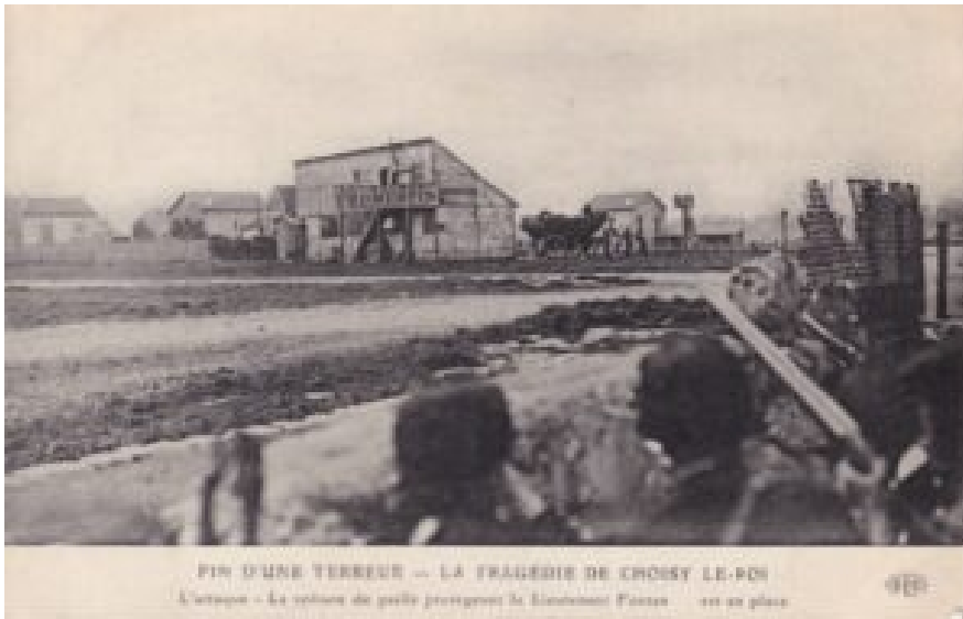
Belegering van de garage waar Bonnot zich schuilhoudt