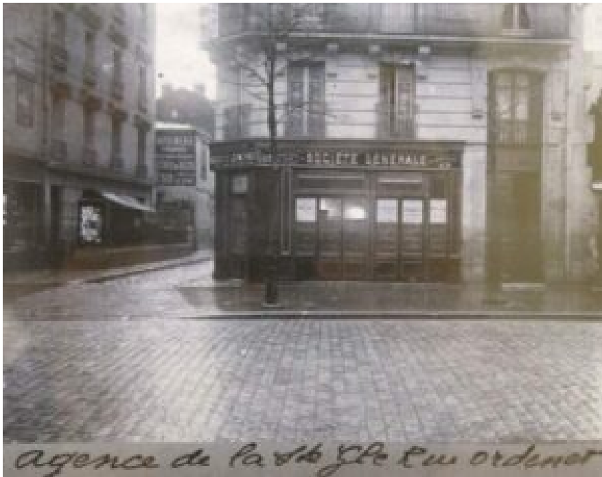
Het filiaal van de Société General in de Rue Ordener