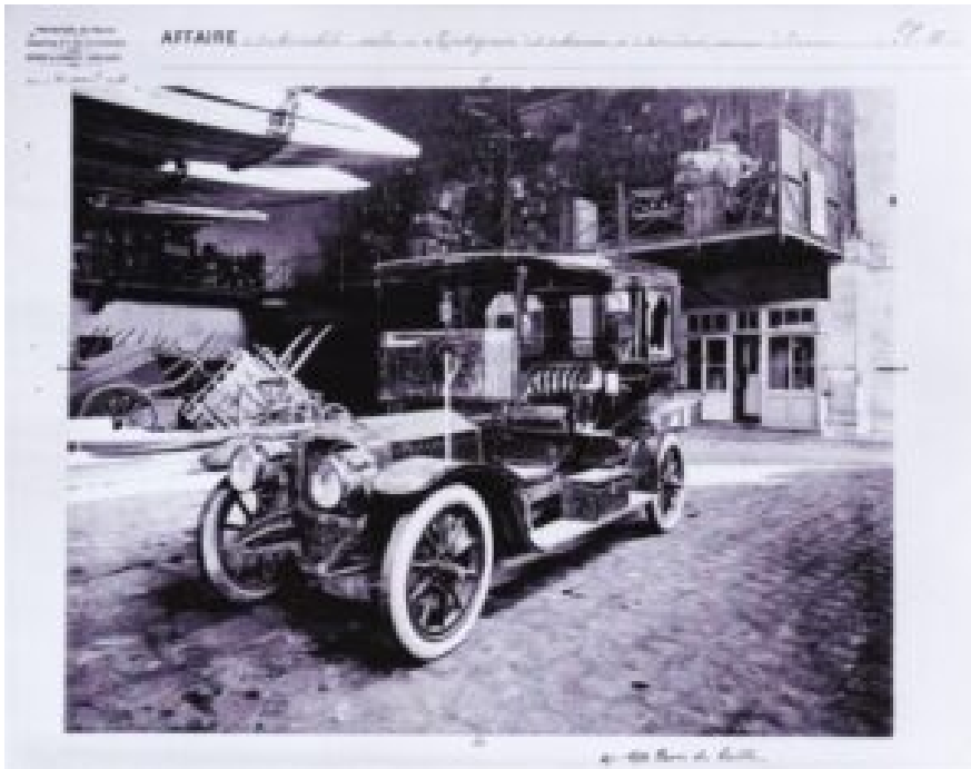
De bij de overval in Chantilly gebruikte De Dion Bouton in een loods van de politie