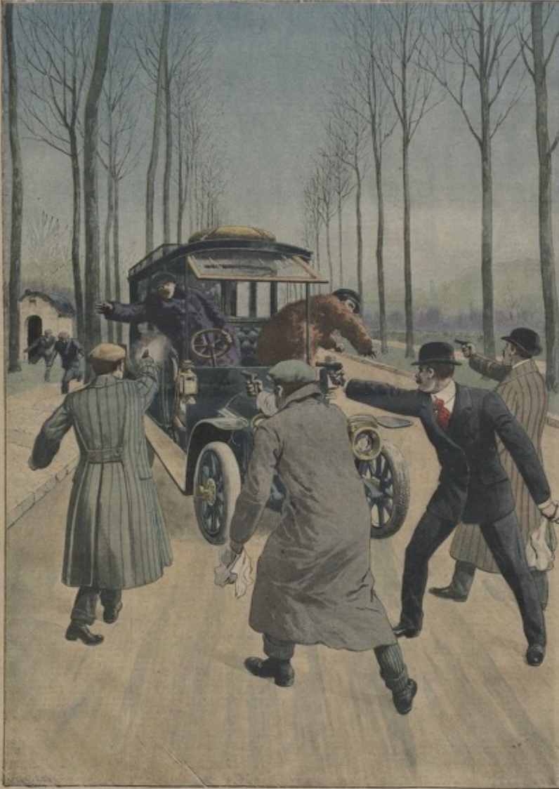
A MONTGERON Le guet-apens dans la forêt de Sénart