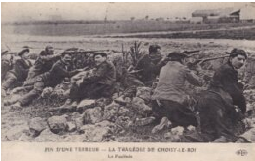
Gewapende mannen bij de belegering