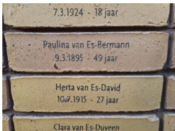
Holocaust Namenmonument Nederland

Ruim 102.000 slachtoffers van de Holocaust hebben na meer dan 75 jaar na de Tweede Wereldoorlog een eigen monument gekregen. In Amsterdam is een monument verrezen met alle namen van de Nederlandse Holocaustslachtoffers die geen graf hebben. Alle namen van Joden, Sinti en Roma die vanuit Nederland zijn vervolgd en gedeporteerd, alsmede gedeporteerde Nederlandse Joden woonachtig in andere landen, die in naziconcentratie- en vernietigingskampen zijn vermoord, alsook zij die zijn omgekomen door honger of uitputting tijdens transporten en dodenmarsen en waar geen graf van bekend is (lees ook: Welke namen komen er op het monument? ). Daarmee heeft Nederland eindelijk een tastbaar gedenkteken waar 102.000 Joden en 220 Sinti en Roma zowel individueel als collectief kunnen worden herdacht.