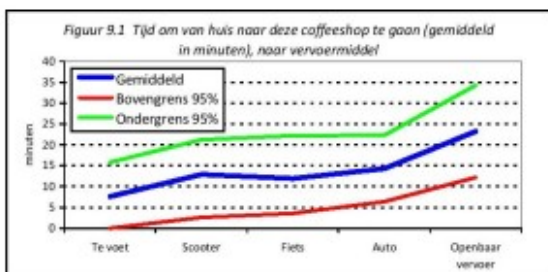
Figuur 9.1 Tijd om van huis naar deze coffeeshop te gaan (gemiddeld in minuten), naar vervoermiddel

Tellen we ook de bezoekers mee die verder weg wonen, dan nog bestaat de grootste groep uit bezoekers die meestal te voet naar deze coffeeshop komen. Op flinke afstand volgt de fiets, daarna komen de auto (soms motor) en de tram, bus of metro. Een kleine minderheid komt meestal met de brommer of scooter en nog minder komen met de trein.