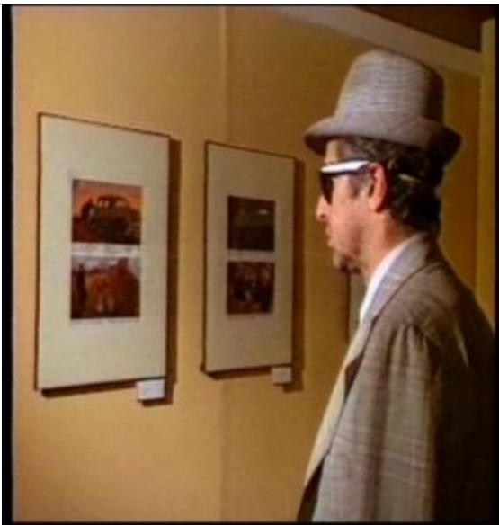
Barney Wilen bekijkt de tentoonstelling met tekeningen uit La Note Bleue

gelijkenis vertoont met Barney Wilen, speelt in de jaren vijftig met jazzmusici als Art Blakey en Kenny Clark, raakt verslaafd aan heroïne en beleeft meerdere tragische affaires met vrouwen. Hij moet in zijn onderhoud voorzien door te spelen in tweederangs jazzorkestjes, die een weinig indrukwekkend repertoire van uitgemolken jazzstandards spelen. Tegen wil en dank wordt het nummer Besame Mucho zijn handelsmerk. Het trieste bestaan van Barney speelt zich af in troosteloze casino's, verlaten Franse badplaatsen en derderangs clubs, om vervolgens iedere dag op een haveloze hotelkamer een spuit met heroïne in zijn arm te kunnen zetten. Vergeten door jazzliefhebbers en zonder vrienden sterft hij in alle eenzaamheid.