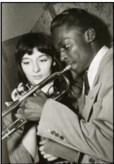
Juliette Greco en Miles

Zwarte musici hadden er nauwelijks last van racistische vooroordelen en discriminatie zoals ze dat in de Verenigde Staten meemaakten. Bovendien heerste er een gunstiger klimaat ten opzichte van drugsgebruik. Heroïne was een veel gebruikte drug onder musici. In Parijs was het niet al te problematisch om in die behoefte te kunnen voorzien. Bovendien was het Franse rechtssysteem aanzienlijk minder streng ten opzichte van het gebruik van harddrugs in vergelijking met de Verenigde Staten, waar de criminalisering en segregatie hand in hand gingen.