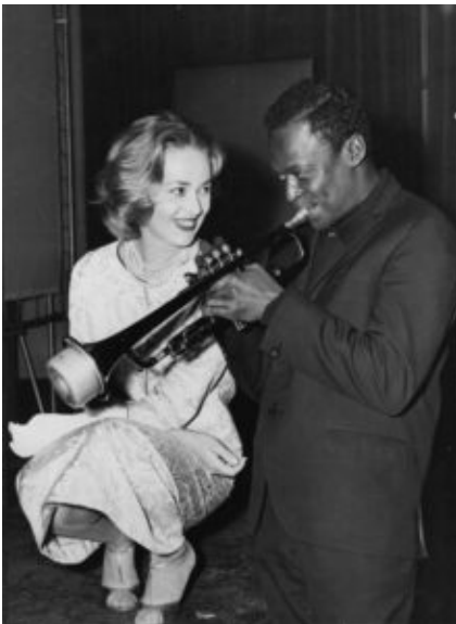
Jeanne Moreau en Miles Davis

Schatplichtig aan Ascenseur pour l'échafaud is ook de beroemde straatcène in Godards A Bout de Souffle (1959), waarin Jean Seberg de Herald Tribune verkoopt op de Avenue des Champs-Élysées en door Jean-Paul Belmondo wordt aangesproken. Door - op de openingsscène na - de hele film op locatie te draaien in plaats van in een studio, doorbrak Godard fundamenteel de bestaande filmtraditie en baande hij de weg voor een nieuwe manier van film maken.