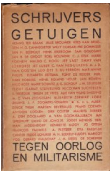
Uitgave Schrijvers getuigen tegen oorlog en militarisme