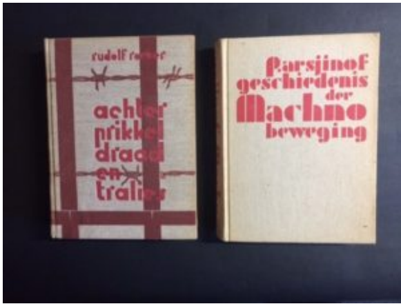
Uitgaven van de VAU