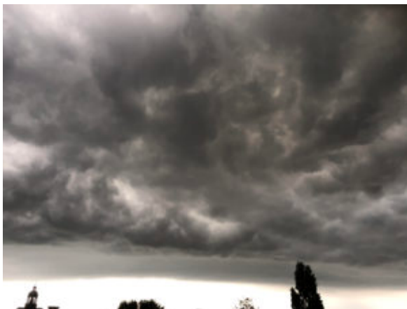
Torenspunt van de Oosterkerk - Foto Neeria Oostra Malaver

De buurt veranderde: van een levendige drukbebouwde buurt die aan de Jordaan deed denken naar een rustigere woonbuurt met veel minder bedrijvigheid.