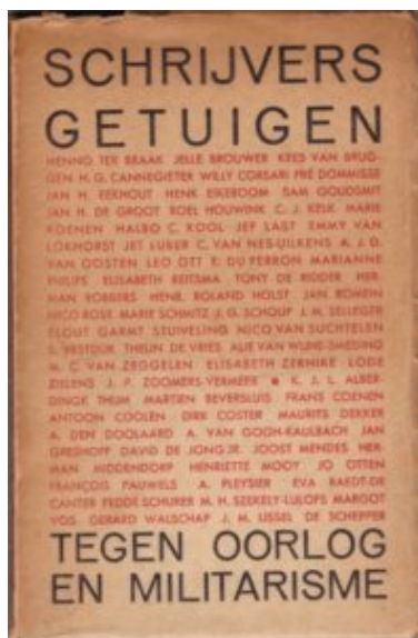
Uitgave Schrijvers getuigen tegen oorlog en militarisme

Nationalisme en Cultuur werd door Bakels naar Nederland gesmokkeld.