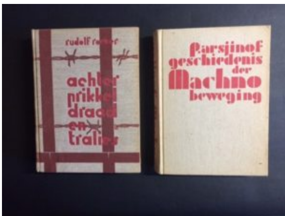
Uitgaven van de VAU