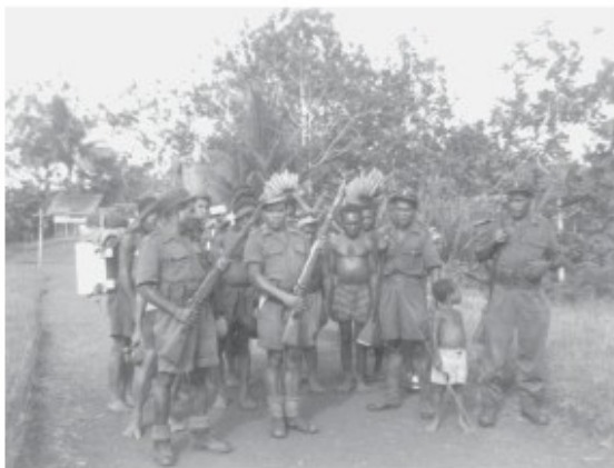
Politie-escorte en dragers