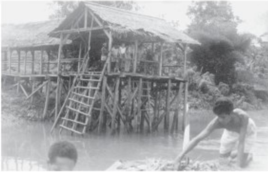
Aanlegsteiger in de Kao-rivier