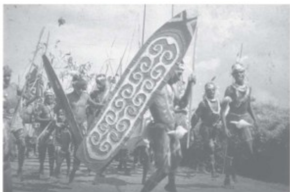
Dansende Mandobo-mannen begroeten bezoekers in Tanah-Merah