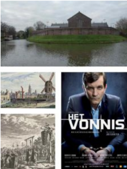
Penitentiare Inrichting Wolvenplein Paardenveld in 1663 Executie Gillis van Leedenberch Filmposter “Het vonnis”