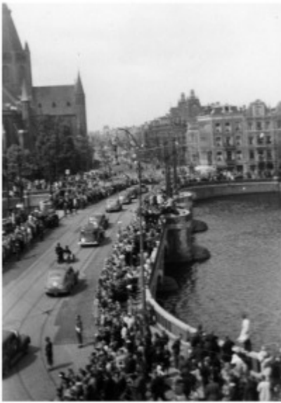
Bevrijding van Amsterdam door de geallieerde troepen, mei 1945