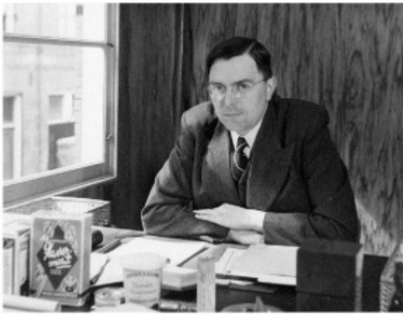
Max Euwe op kantoor