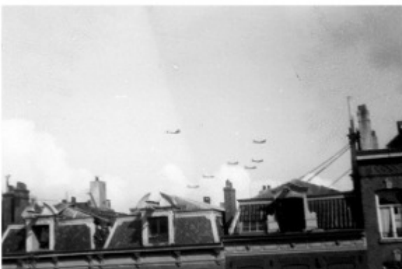
Vliegtraject boven Amsterdam