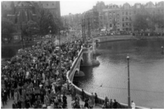
Bevrijding Amsterdam bij kanoor Weesperzijde 34