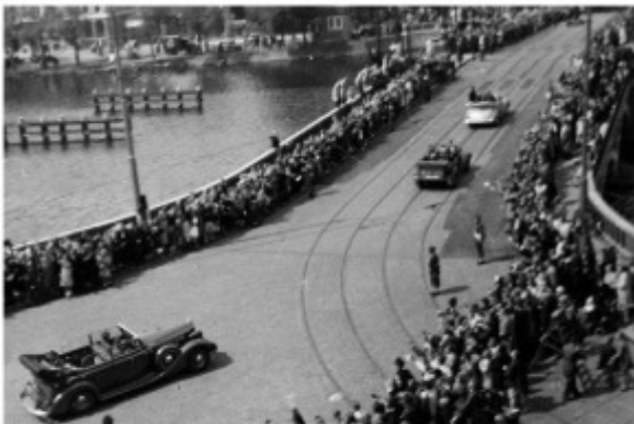
Intocht gallicierden bij kantoor Weesperzijde 34, mei 1945