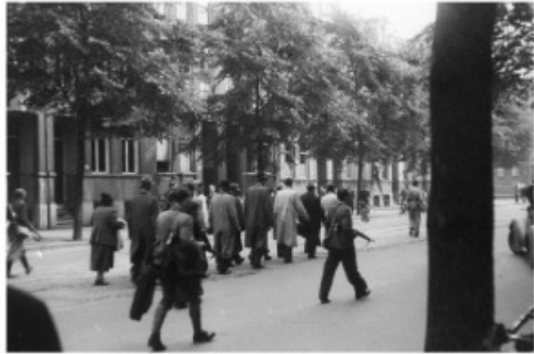
Foute Nederlanders in Surphatistraat