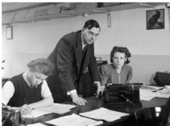
Kantoor van de kruideniersfirma Van Amerongen, met in het midden Max Euwe