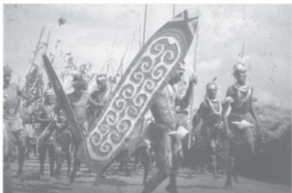
Dansende Mandobo-mannen begroeten bezoekers in Tanah-Merah