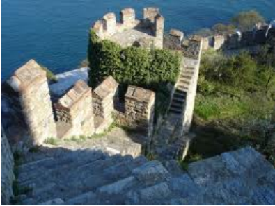
Kasteel van Bouillon

een vrije doortocht naar de hemel. 'De enige vorm van fysieke straf was de gevangenen op kruistocht te sturen. Ze verdwenen voor jaren uit het zicht van de gemeenschap. Wanneer ze onderweg stierven dan was dat voor een goed doel. Kwam het geboefte heelhuids terug, dan hoopte men dat ze een spirituele ervaring rijker waren, die hun karakter positief had beïnvloed.'