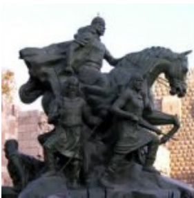
Standbeeld van Saladin

De Syrische chauffeur, die het interieur van zijn gele Chevrolet uit de jaren zestig heeft behangen met afbeeldingen van de (toenmalige) president Hafez Al Assad en diens overleden zoon, rijdt over de brede toegangswegen van Damascus' moderne buitenwijken naar het centrum van deze eeuwenoude stad met haar sfeervolle soek, de beroemde Omayyaden moskee, het Al-Azm paleis, de oude christelijke wijk en het heilige shi'itische mausoleum van Zena dat dagelijks door duizenden gelovige moslims wordt bezocht. Gebruinde mannen zitten op de stoep van een theehuis te praten en te lachen, spelen een spelletje triktrak en roken ondertussen een nargileh , een waterpijp. Kooplustige vrouwen schuifelen gehuld in hun zwarte chadors langs de vele kraampjes en winkeltjes met stoffen en snuisterijen. Een slangenbezweerder bespeelt zijn fluit en hoopt op deze manier een paar Syrische ponden te verdienen. Jonge meisjes verdringen zich voor de enige ijssalon die de Damascense soek rijk is: het is een geheime ontmoetingsplaats met de jongens. Tegenover de Omayyaden-moskee bevindt zich het mausoleum van Saladin, de legendarische middeleeuwse leider die na bijna