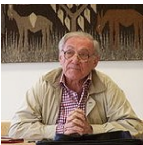
Sadiq Jalal Al-Azm

Jonge Syrische mannen met stoppelige baarden en de ogen verscholen achter de eeuwige zonnebril, bewegen zich met kalasjnikovs losjes ronde de schouder door het straatbeeld van Damascus. Ze nemen aanzienlijk in aantal toe wanneer de