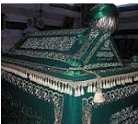
Graf van Saladin

De tombe van Saladin is te bezichtigen in een klein maar waardig museum. Op de binnenplaats van het mausoleum bevinden zich een fonteintje en een schaduwrijke boom. Een vrouw met een verveelde uitdrukking op haar gezicht leidt blootsvoets een paar nieuwsgierige landgenoten naar de tombe en biedt ze na een korte rondleiding wat ansichtkaarten aan. Afdgedekt met damasten doeken staan twee sarcofagen broederlijk naast elkaar. In de witmarmeren doodskist liggen de resten van Saladin, in die van steen en donkerbruin houtsnijwerk ligt zijn particuliere secretaris. In 1898 schonk de Duitse keizer Wilhelm de Tweede tijdens zijn bezoek aan Damascus geld om de restauratie van het mausoleum mogelijk te maken.