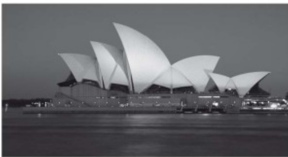
Opera House in Sydney

De Bredero-leiding zocht in de jaren vijftig naar mogelijkheden om haar Australische succesformule in andere landen te herhalen. In 1953 werkte ze plannen uit om in Nieuw-Guinea actief te worden. Net als in Australië zou ook hier de overheid de opdrachtgever zijn, in dit geval betrof het de Dienst Opbouw Nieuw-Guinea. Het idee om hier te gaan bouwen werd Bredero aan de hand