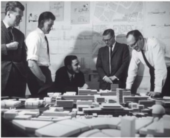
Het ontwerpteam rond een maquette van Hoog Catharijne