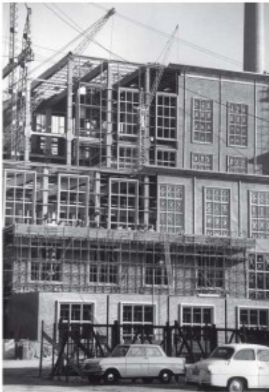
De bouw van de centrale Lage Weide in Utrecht (1959)

aantal projecten woningbouwprojecten te beperken om zijn capaciteit niet te veel te belasten. Behalve eengezinswoningen, trok het bedrijf ook voor het eerst flatwoningen op. In Utrecht bouwde Bredero onder andere portiekwoningen in Zuilen en Kanaleneiland. Tevens richtte het bedrijf zich meer en meer op het bouwen van utiliteitswerken als fabriekshallen, het ziekenhuis Oudenrijn en de Pegasuscentrale aan het