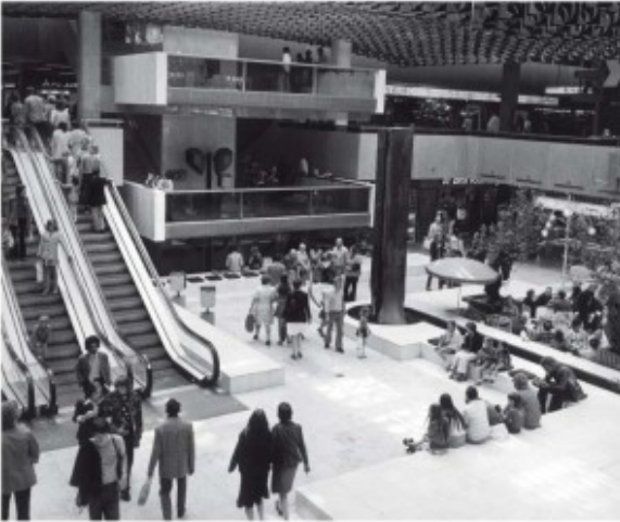
De Clarentuin in Hoog Catharijne met olijfbomen (1973)

Ten tijde van de opening van fase twee van Hoog Catharijne waren de gemoederen in de stad verhit. Prinses Beatrix, die het complex zou gaan openen, werd bestookt door briefschrijvers die haar verzochten niet naar Utrecht te komen. NRC-Handelsblad vroeg bij deze gelegenheid: 'Heeft Utrecht zijn ziel aan de duivel verkocht? (lxxxv) ' Op de avond van 25 september 1973 demonstreerden drieduizend mensen tegen de totstandkoming van het winkelcentrum dat 's middags officieel geopend was. De Mobiele Eenheid voorkwam dat de demonstranten Hoog Catharijne binnentrokken.