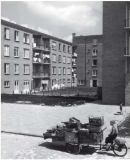
Door Bredero gebouwde woningen in de Amsterdamse uitbreidingswijk Bos en Lommer (1951)