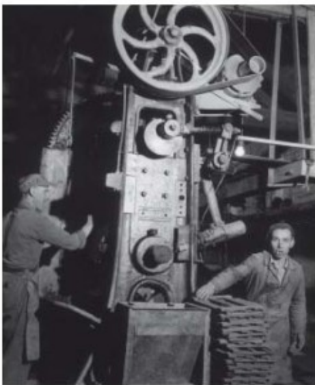
De dakpannenfabriek Swalmen

begin jaren vijftig te klein werd, verhuisde het naar De Meern. In later jaren hield de staf zich ook bezig met het testen van andere materialen dan alleen beton. In dezelfde periode besloot de directie ook haar productie te verbreden. Als eerste kocht ze de N.V. Timmer- en Meubelfabriek 'De Oude IJssel', in 1949 volgde dakpannenproducent 'Swalmen', daarna gresbuizenfabriek 'Belfeld'. Op basis van een volgende Amerikaanse reis ging de directie in 1950 tevens over op de fabricage van betonnen dakpannen. Ze berekende dat de kostprijs hiervan 10% onder die van gebakken dakpannen lag. Ook hiervoor importeerde ze de benodigde productieapparatuur uit de Verenigde Staten( ix ).