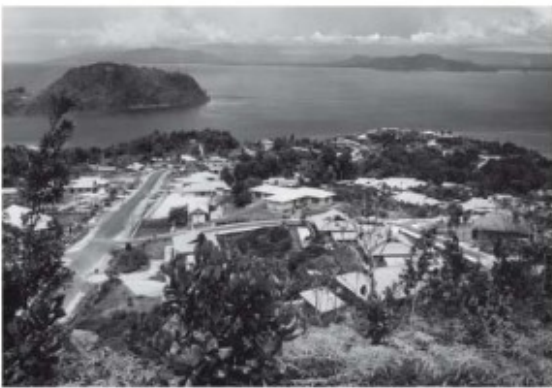
Gezicht op Hollandia (Nieuw-Guinea)

Het faillissement van Bredero in 1987 doet natuurlijk niets af aan de prestaties van alle ondernemingen van het Bredero-concern gedurende tientallen jaren in Nederland en in het buitenland. Een onderneming is niets zonder haar medewerkers. Ik matig me geen oordeel aan over die duizenden medewerkers, omdat ik over hun inzet en bekwaamheden amper of niet kan oordelen. Ik denk dat aan de Bredero-medewerkers in Nederland en daarbuiten in de kern van dit boek aandacht zal worden besteed.