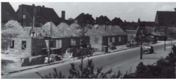
Woningbouw in 's-Hertogenbosch