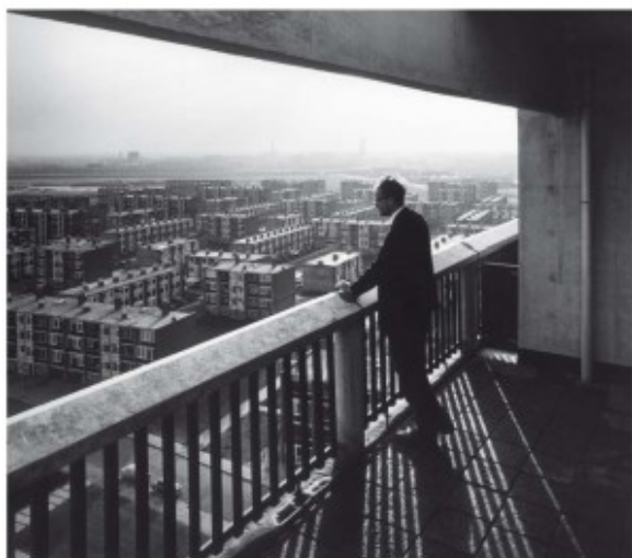
Door Bredero gebouwde flats in Terborgh (Twente)

bouwbedrijf en zijn dochterbedrijven werd in 1962 de 'Verenigde Bedrijven Bredero' (VBB) opgericht waarbij dochterbedrijven in de divisies 'uitvoering', 'fabricage' en 'vastgoed' werden ondergebracht. Elke divisie werd voorzien van een eigen directie die geacht werd zelfstandig beleid te voeren.