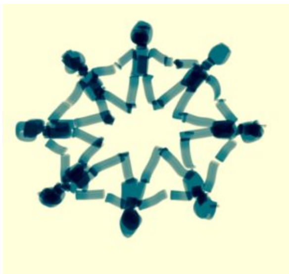
“Alfa-Bèta-Cirkel”, Ontwerp Hans Jakobs, 2020

Zo zal het vooral een kwestie van ordening en structurering zijn, van de al in ruime mate aanwezige NFI-informatie per deskundigheidsgebied, om deze - samen met de betreffende NFI-deskundigen - in de definitieve Blauwdruk-uni-vorm te gieten.