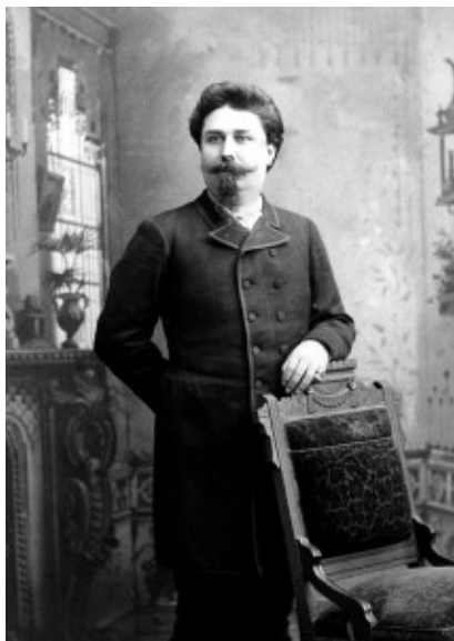
Joseph Labadie (1890)