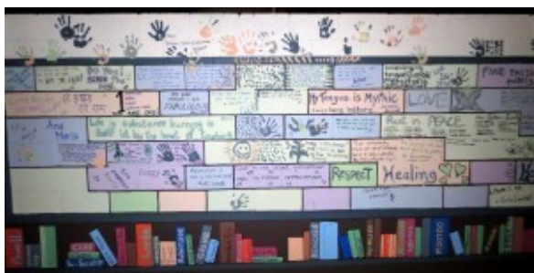
Sexualities in the Tent, Wall Mural at Bohemia, Port of Spain, Trinidad and Tobago, July 2013

Movements for sexual citizenship and equal rights for sexual minorities across the region (particularly in the Anglophone and Hispanophone Caribbean) are growing and have garnered local and international media attention. With recent court cases challenging discriminatory laws and the backlash and frenzy over a so-called “gay lobby” in the region, we are at a crucial juncture of visibility, misrepresentation, anti-sexual minority violence, increased activism, lawsuits, and ongoing survival. It is a vital time to respond to recent events critically and from myriad perspectives, as well as to reflect on these movements, make interventions, fight against misrepresentation and violence, and share strategies for community building and solidarity. What is the landscape of sexual minority activism across the region? Who are the regional activists and what are the most recent developments? How are these issues being represented in the media, popular culture, and cultural productions in the English-, Spanish-, French-,