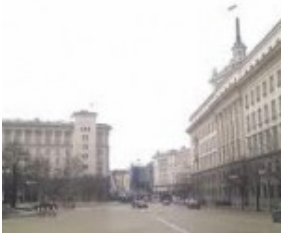
Boulevard Tsaar Osvoboditel

Het is laat in de avond en heel stil op het kale stationsplein van Sofia. Her en der liggen langs de straat verformfaaide hoopjes kinderen der duisternis te wachten op een nieuwe uitzichtloze dag. 'Ontwaakt verworpenen der aarde...' In het overgangsgedebied tussen de afgezworen idealen en de nieuwe toekomst ligt voor de meeste mensen hier een groot schemergebied, dat wordt al snel duidelijk. Een enkeling heeft het geluk naar zijn hand kunnen zetten en scheurt in een BMW voorbij. De elektriciteitscentrale spaart haar krachten en de straatlantaarns bestaan uit louter dode ogen. Na lang wachten duikt in het schemerdonker eindelijk een taxi op. Een kilometerslange rit eindigt op een industrieterrein, waar tussen duistere containers en geparkeerde vrachtwagens een prefab gebouwtje als enige wat licht uitstraalt. Uit de ontmoetingsruimte klinkt gejuich van in hot pants of trainingspak geklede hoeren. Hoe kwetsbaar is de reiziger na aankomst in een vreemde stad.