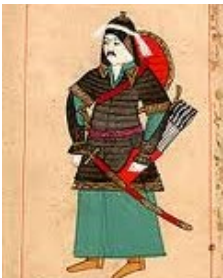
Sultan Kilij Arslan

De afgeschoten Turkse pijlen zagen er uit als 'stekelvarkens of dicht bezette speldenkussens waar geen schild tegen bestand was. De wapenuitrusting van een kruisridder bestond in die tijd ondermeer uit 'een lans van berkenhout, voorzien van een ijzeren spits en met een vlaggetje versierd benevens een zwaard, onderscheidende soorten pijlen, een strijdbijl en een knots. Tot de verdedigende wapens behoorde de ronde of de vierkante schilden, het pantserhemd of maliënkolder, de helm met een pluim en een wapenstok. De gewapende pelgrims waren met hun schild van hout, leder of staal, de zwarte kuras, de ijzeren of bronzen helm, de wollen lijfrok en de met maliën bedekte paarden voor de inwoners van het oosten een nieuw schouwspel. En sultan Arslan zag op het slagveld voor het eerst hoe de lansen van de Franken flikkerden als glinsterende sterren. De kurassen en schilden wierpen een licht af gelijk dat van de morgenstond in de lente en het gedruis van hun wapens was vreselijker dan dat van de donder.'