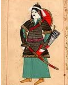
Sultan Kilij Arslan

morgenstond in de lente en het gedruis van hun wapens was vreselijker dan dat van de donder.'