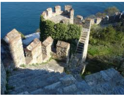
Kasteel van Bouillon

naar Jeruzalem vertrokken. Maar er wordt ook beweerd dat het in feite geen kruis is, maar afsluitingen of resten van de paardenstallen. 'Samen met Saksen, Engelsen, Duitsers, Italianen, Fransen en Hollanders alsmede gevangenen en avonturiers trokken veel Vlamingen met de grote karavanen mee in oostelijke richting' zegt Deleux. In de Middeleeuwen ontbraken officiële gevangenissen. Er waren slechts enkele cellen in de kelders van de kastelen. Veel geboefte werd dan ook door de geestelijkheid op pelgrimage gestuurd. Sterven in de strijd betekende een vrije doortocht naar de hemel. 'De enige vorm van fysieke straf was de gevangenen op kruistocht te sturen. Ze verdwenen voor jaren uit het zicht van de gemeenschap. Wanneer ze onderweg stierven dan was dat voor een goed doel. Kwam het geboefte heelhuids terug, dan hoopte men dat ze een spirituele ervaring rijker waren, die hun karakter positief had beïnvloed.'