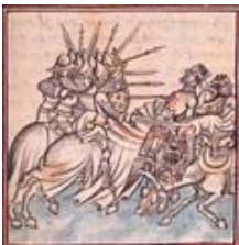
Battle of Dorylaeum

Het volgende doel is de stad Eskisehir, honderd kilometer naar het oosten. De weg van Iznik naar Eskisehir komt uit op de oude Byzantijnse hoofdweg die dwars door Anatolië loopt. Eskisehir werd 100 jaar v.Chr. aan de oevers van de rivier de Sangerius gesticht die tot de dag van vandaag dwars door de almaar uitdijende stad stroomt. Zandkleurige woonblokken domineren de moderne buitenwijken die aan een verlaten uitgestrekt gebied grenzen dat in de geschiedenisboeken vermeldt staat als de vlakte van Dorylaeum. 'Merheba,' groet een jonge schaapsherder terwijl hij uitkijkt over de kale grasvlakte. Zijn leren jas hangt losjes ronde de schouders. Af en toe wrijft hij zich in de handen om zich te warmen. Zijn hond rent achter een paar verdwaalde schapen aan. Aan de horizon doemen besneeuwde bergen op. Onder de aarde van deze vlakte moeten de tot stof vergane beenderen liggen van de vele slachtoffers van de slag bij Dorylaeum.