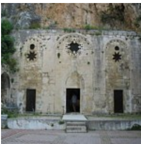
De kerk van de heilige Petrus

In Antiochië, verhaalt de bijbel, kwamen de eerste predikers aan, die de Griekse heidenen de leer van Jezus verkondigden: 'En een groot getal bekeerde zich tot de Heere. Het was in Antiochië dat de discipelen voor het eerst christenen werden genoemd.' Een belangrijk deel van de bevolking bestond uit joden, die vrij gemakkelijk overgingen tot de leer van de rebelse profeet Jezus. Zo werd Antiochië het bruggenhoofd voor de missie onder de heidenen en het vertrekpunt van de Apostel Paulus' eerste Apostolische reis door het Midden-Oosten. Vóór zijn vertrek naar Rome woonde de Apostel Petrus van 42 tot 48 in Antiochië en even buiten de stadskern ligt de door hem gestichte Kerk van St. Petrus, die wordt beschouwd als de eerste kerk van het christendom.