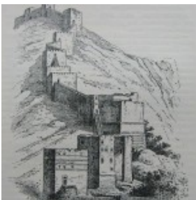
De stadsmuren op de berg Silpius

Als afgebrokkelde kiezen in een kaak steken de restanten van de historische stadsmuur over de volle lengte van de Silpiusberg omhoog. Groter en onneembaarder dan de muren van Constantinopel en Nicaea liep ze met haar vierhonderd torens over een afstand van bijna tien kilometer vanaf de rivier de Orontes over de zeer steile bergrug omhoog en vandaar met een boog terug naar de stad om weer bij de rivieroever te eindigen.