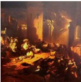
De verovering van Antiochië

Bitter was de nasmaak. Terwijl de overwinnaars aan het feestvieren waren had de Seltsjoekse emir Kerbogha Antiochië omsingeld en de kruisvaarders ingesloten. De stad zou waarschijnlijk nooit door de kruisvaarders zijn ingenomen, wanneer hij eerder was aangekomen, maar de onderlinge verdeeldheid onder de moslims was groot en terwijl Kerhogha op de steun van zijn collega memirs wachtte had hij kostbare dagen verloren. De emir van Aleppo ruziede met die van Damascus en de emir van Homs kon het bloed wel drinken van zijn collega in Menby. Uiteindelijk zouden al deze onderlinge vetes de snelle doortocht van de kruisvaarders naar Jeruzalem bevorderen. Ook binnen Kerbogha's leger waren er fricties tussen de Turkse en de Arabische strijders en net als in onze tijd speelden