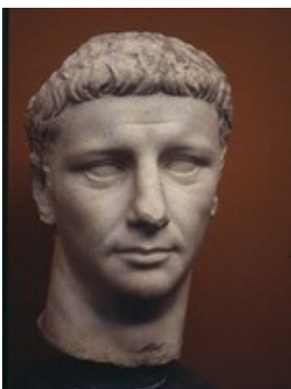
Claudius Claudinius (ca. 370 - ca. 404)

In het huidige Engeland bezit het koningshuis geen politieke macht, maar heeft